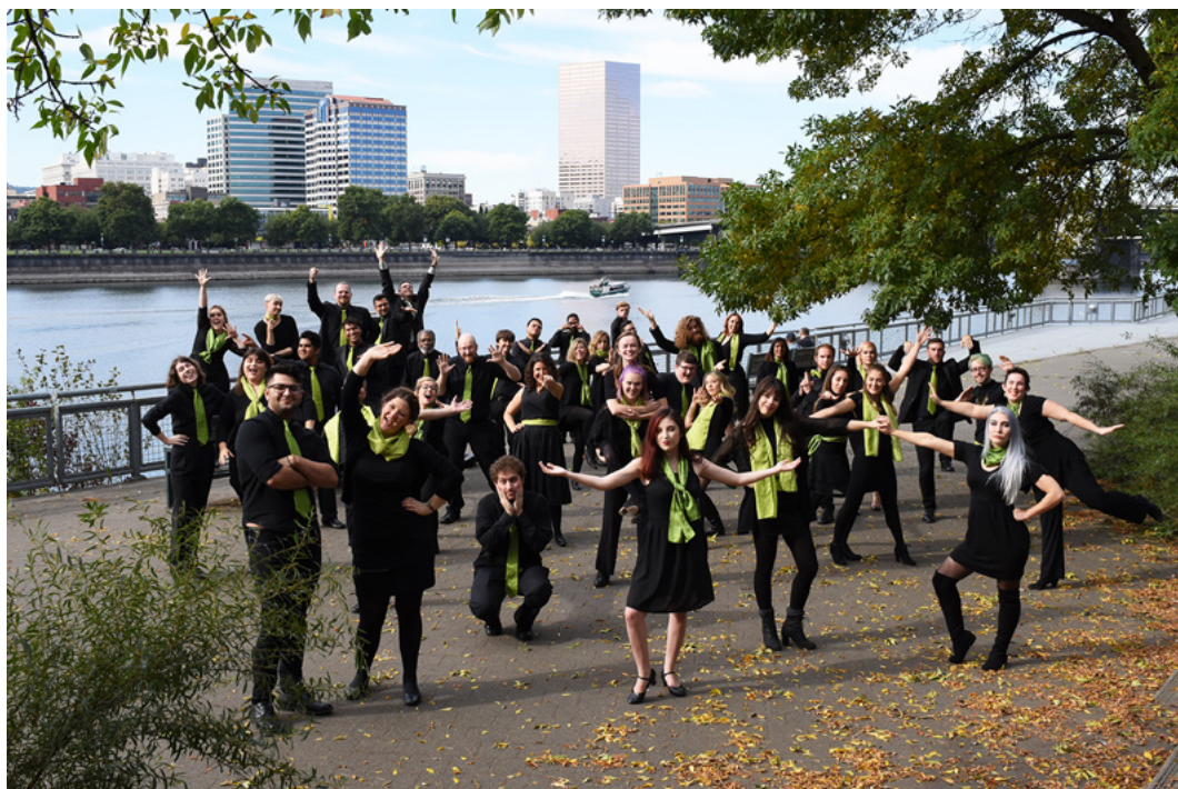
Portland State Chamber Choir