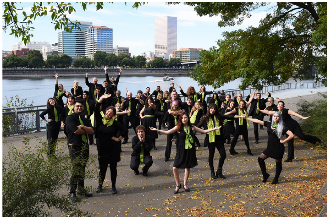
Portland State Chamber Choir

“クラシックス・トゥデー”は、ポートランド州立室内合唱団を「世界最高峰の合唱団のひとつ」と評しています。1975年の創設以来、この室内合唱団はアメリカ合衆国全土および全世界のさまざまな会場で公演を行い、他の団と競ってきました。国際合唱コンクールで獲得したメダルや賞は30を超え、イタリアのセギツィ国際合唱コンクール(2013年)で優勝した唯一のアメリカの合唱団でもあり、インドネシアのバリ国際合唱祭(2017年)にも参加しています。また、全米合唱指揮者協会や全国音楽教育協会の全国会議や地域別カンファレンスでも複数回、演奏しており、2014年には、全国大学合唱協会の全国会議の主催者となっています。2011年2月、彼らは、ポートランド生まれの作曲家、モートン・ローリゼンと共演しました。ローリゼンは、彼らの歌を「合唱の才能の究極の表出」と評しています。この合唱団の指揮者は、イーサン・スペリーです。