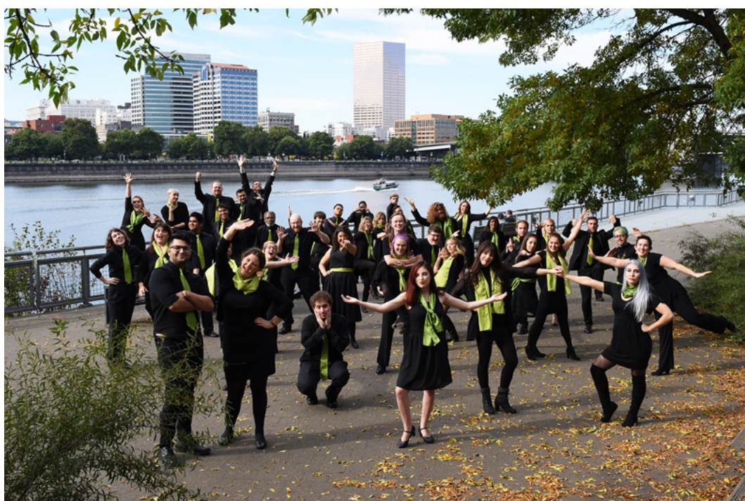
Portland State Chamber Choir

través de la música coral al unir a personas de una variedad de orígenes, culturas, edades, experiencias profesionales / musicales a través de su amor por la música. Así como un mosaico toma diferentes piezas de vidrio o piedra de colores para crear una obra de arte, también lo hace Mosaica, que reúne a personas diversas para crear un sonido hermoso. El coro ofrece a los miembros un ambiente acogedor para el crecimiento musical y personal, así como el privilegio de ser parte de la creación de actuaciones musicales de alta calidad. Como parte de su misión, los cantantes abordan diferentes tipos de música coral, contribuyendo a ampliar sus horizontes musicales y culturales. El trabajo del coro se extiende a su comunidad, ya que el conjunto se dedica al crecimiento y enriquecimiento de la escena cultural en Jordania, influyendo particularmente en las generaciones futuras e inculcando en ellas el amor por la música.