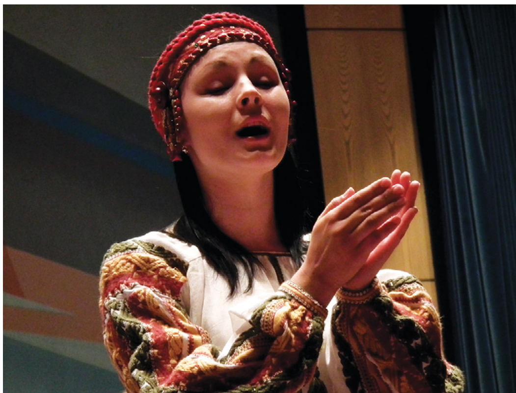
One chorister of the Female Choir of Glier Institute of Music, Kyiv

Den vollständigen entsprechenden Artikel können Sie HIER anklicken. Er enthält eine Anleitung zur Benutzung der Datenbank zum obigen Thema, die Beschreibung einiger Chorstücke, die mit einer Suche gefunden wurden, sowie den Link zum privilegierten und uneingeschränkten Zugang als Mitglied der IFCM mit alle Möglichkeiten der Webseite (Sie können dort auch falls gewünscht die Sprache wählen).