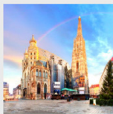
November - December 2022 & 2023