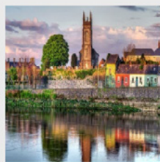
June 9-13, 2023