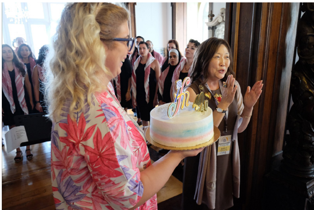
Happy Birthday IFCM!