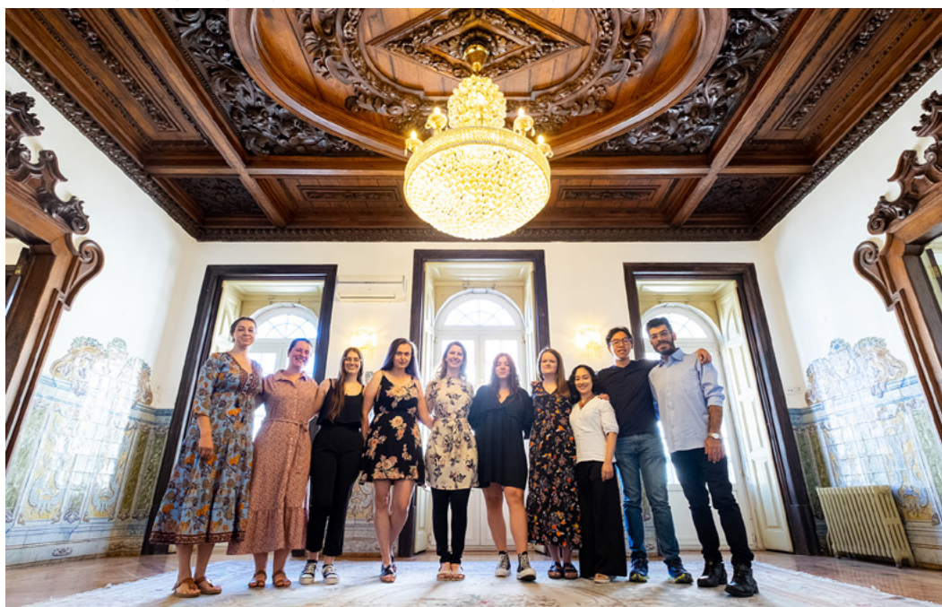
YOUNG participants at the Palacete dos Condes de Monte Real