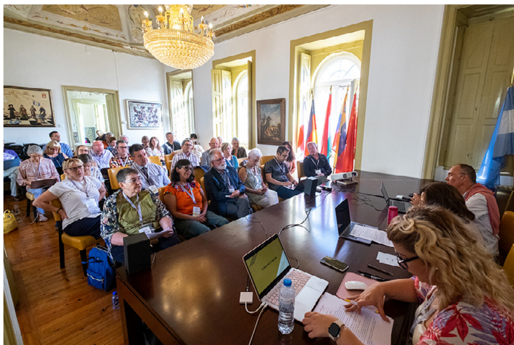
IFCM 2022 General Assembly at the Palacete dos Condes de Monte Real

Nach einer erfolgreichen Online-Abstimmung mit dem Ergebnis zahlreicher Änderungen in der Satzung der IFCM und dem Membership Policy document* nahmen mehr als 50 IFCM-Mitglieder an der Generalversammlung 2022 (4. September 2022) im Palacete dos Condes de Monte Real (Lissabon, Portugal) teil. Sie konnten Berichte über die Projekte und Aktivitäten der IFCM hören, Fragen stellen und Vorschläge machen.