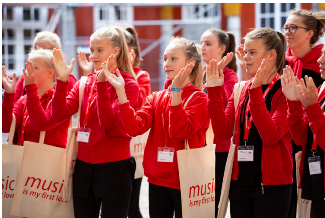
Eurotreff 2019

Mehr als 700 junge SängerInnen aus ganz Europa werden sich beim 20. EUROTREFF in Wolfenbüttel, Deutschland, vom 6. -10. September 2023 wieder treffen und durch Musik wunderbare und einzigartige Erinnerungen schaffen.