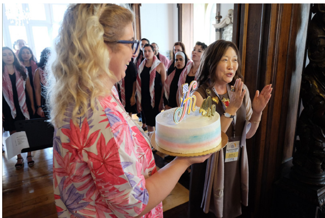
Happy Birthday IFCM!