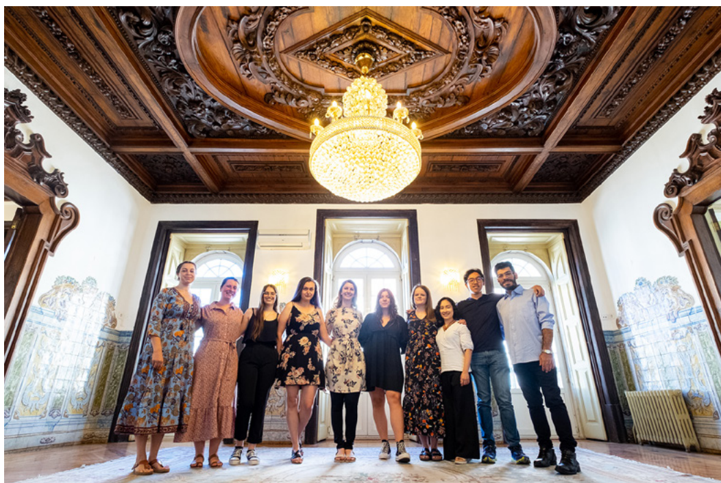
YOUNG participants at the Palacete dos Condes de Monte Real