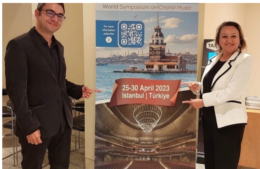
Turkish Deputy Minister of Culture, Mrs. Özgül Özkan Yavuz, and Dr. Burak Onur Erdem, at the Cultural Center of Belém in Lisbon on September 7, 2022.

Suscríbete para recibir actualizaciones por correo electrónico de WSCM2023 en https://www.wscmistanbul2023.com y siga a WSCM2023 en las redes sociales ( Facebook , Instagram ).