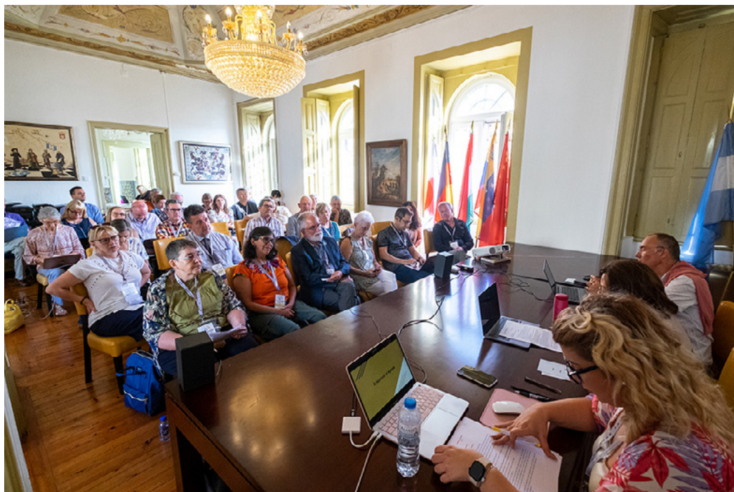
IFCM 2022 General Assembly at the Palacete dos Condes de Monte Real