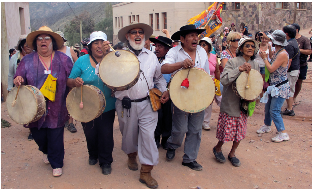
'Baguala' chantant dans les Andes argentines

Le chant harmonique est donc d'origine culturelle: il n'existe aucune raison naturelle qu'une personne naisse avec cette capacité. Bien sûr, à chaque son correspondent des harmonies et nous savons que les cinq premiers forment les sons de l'accord majeur; mais ce n'est pas la raison du chant harmonique en Afrique, pas plus que le chant à trois tons, qui est également basé sur les notes constitutives de l'accord. Ceux-ci sont principalement utilisés dans la baguala , une musique traditionnelle chantée par les autochtones de la communauté andine en Amérique du Sud. Bien sûr, l'existence de sons harmoniques a permis à ce type de chant de développer ses racines anciennes, mais dans ce cas, la capacité de chanter de cette manière est acquise en chantant ainsi. Dans le cas de l'Afrique, il a fallu des caractéristiques particulières pour rendre ce mode de chant folklorique et populaire à travers des clichés ou des formules mélodiques harmoniques ou