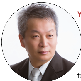
YOSHIHIRO EGAWA (JAPON)

le monde. La formation et le développement de chefs de chœurs et de choristes, l'expansion des chœurs d'enfants et de jeunes adultes, l'échange entre les chorales africaines et celles d'autres parties du monde, le partage des répertoires, des études et des publications sur le monde choral sont tous des axes qui doivent être pris en compte. La célébration de la Journée mondiale du chant choral va également contribuer à l'appréciation de la musique chorale à travers le monde. La FIMC est ouverte à tous les continents: par conséquent, le monde entier doit se connecter. Ainsi quand nous parlerons de la Musique Chorale, tout le monde pensera immédiatement à la FIMC. C'est un véritable plaisir pour moi que de servir cette grande organisation, et de me joindre aux membres dynamiques et enthousiastes du Bureau. Je suis confiante qu'en unissant nos forces, nous serons capables de mener à bien nos projets.