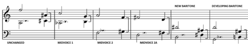
Fig 1: Les phases du développement du larynx chez le garçon adolescent 2