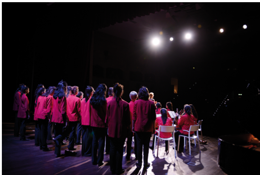
Pymble Chorale (Australie)