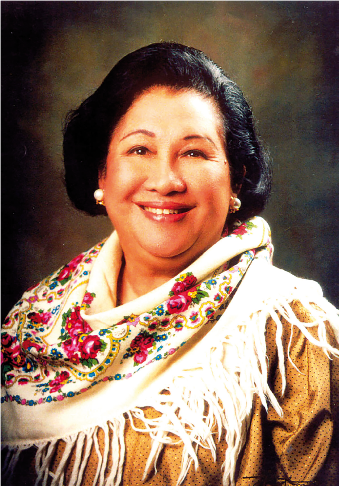
Prof. Andrea Veneracion (1928-2013)