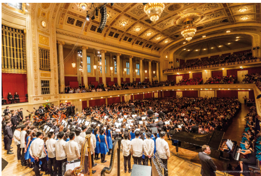
Le concert de gala des gagnants à la 'Wiener Konzerthaus'

L'événement se déroule sur cinq jours. Les temps forts du festival comprennent la compétition qui se tient au Musikverein , connu dans le monde entier, les ateliers qui ont lieu à l'Université de Musique de Vienne, et pour finir le Winner's Concert Gala (Concert de gala des Lauréats), donné au Konzerthaus . Le Summa Cum Laude International Youth Music Festival offre l'occasion unique de pouvoir participer à l'événement en tant que chœur, orchestre, ou ensemble de musique. D'une part cela permet au festival de s'enrichir musicalement, et d'autre part cela permet à des écoles et à