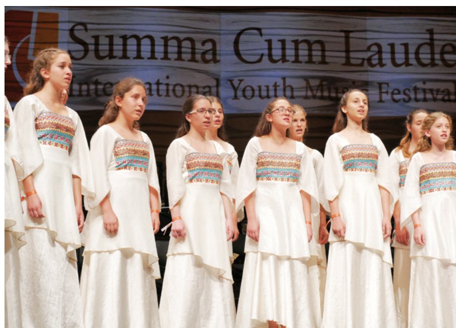
Choeur israélien Efroni au MuTh, la salle de concert du 'Vienna Boys Choir'

Ce désir de diversité culturelle et d'échange interculturel a également façonné les éléments constitutifs du festival. "Depuis le début, nous avons mis l'accent sur la possibilité d'échanges interculturels au sein des ateliers, afin que les ensembles apprennent ensemble mais également les uns des autres. Ainsi, chaque chœur participe à deux ateliers: un avec un autre chœur