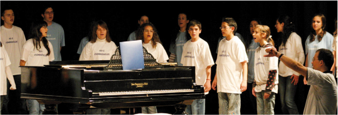
Fig. 4: Groupe choral d’adolescents “Voces para la convivencia” (lors de la puberté, les garçons chantent avec les filles en employant les arrangements décrits ici)

Toutefois, il est également possible d’adapter le répertoire à deux et/ou trois parties vocales en se fiant à un des deux tableaux précédents, et vous pouvez aussi créer votre propre arrangement. Voici un exemple d’un morceau choral scolaire à trois parties, arrangé spécifiquement pour tous les types de voix adolescentes (masculines et féminines). Les filles peuvent se diviser en trois parties vocales (en chantant la partie grave une octave plus haut qu’écrit). Quant aux garçons, ils peuvent facilement trouver une partie qui peut convenir à leur voix muante, en chantant la mélodie du groupe de filles correspondant à une octave de distance ou à l’unisson, selon la situation.