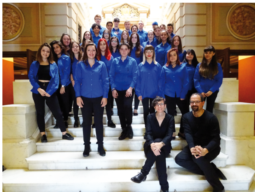
Fig. 8: Chœur mixte de jeunes "Voces para la convivencia" , au Festival International Choral d'Iași (Roumanie), où les garçons les plus âgés sont désormais des chanteurs matures et compétents répartis en deux pupitres (ténors et basses)

Traduit de l'anglais au français par Emmanuelle Fonsny, Barbara Pissane et Laura Teixeira, relu par Jean Payon.