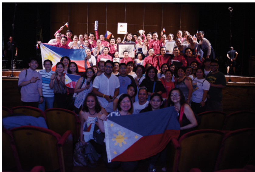
Le Choeur de Chambre de Manille célèbre la victoire