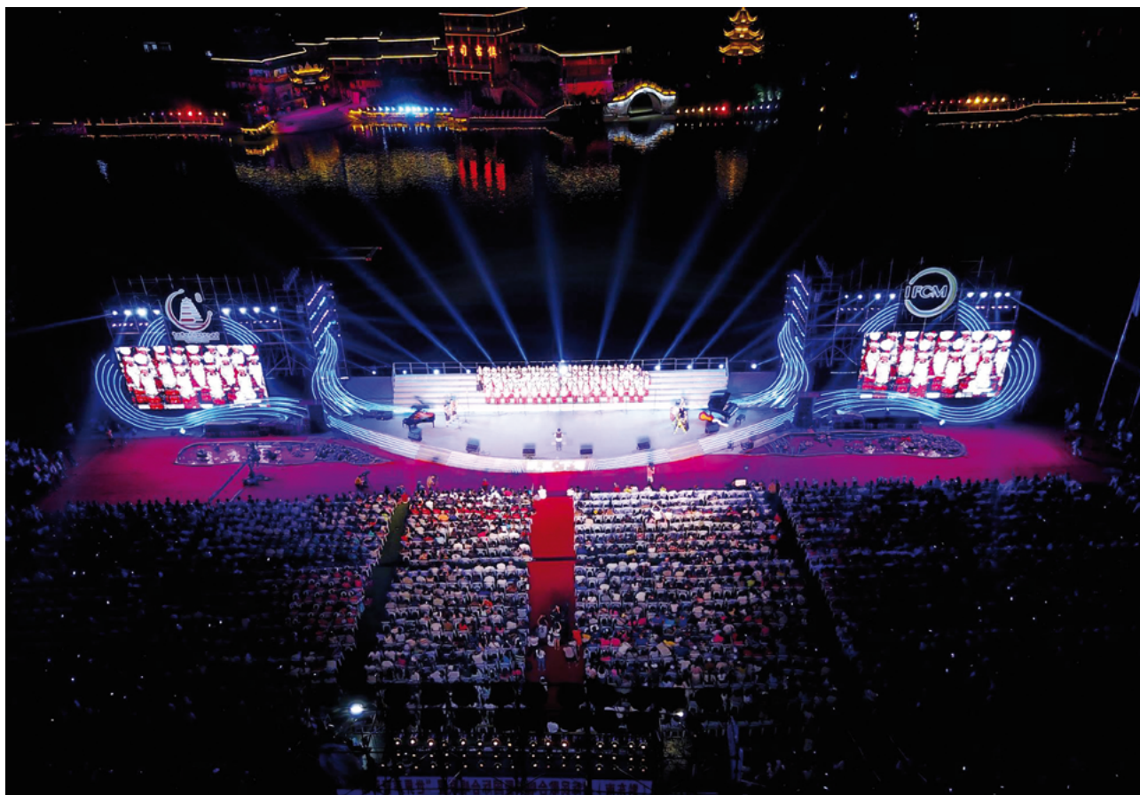
Cérémonie d'ouverture du Festival international de chant choral populaire de Kaili