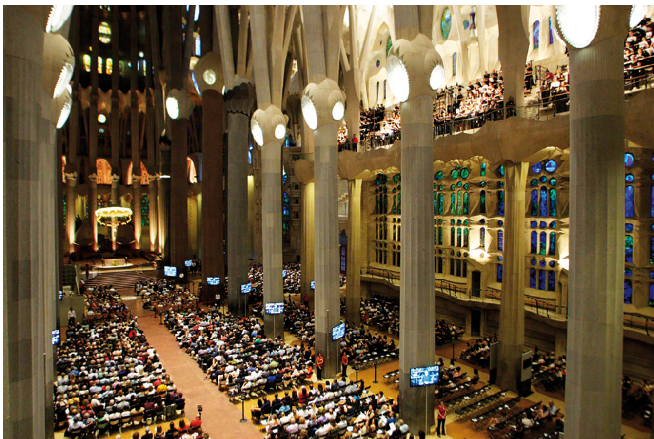
Concert spécial à la basilique La Sagrada Família le 26 juillet 2017: musique sacrée catalane par des chœurs et des chefs catalans

Pour atteindre ces buts un appel international a été lancé, afin de sélectionner des chœurs ainsi que des conférenciers