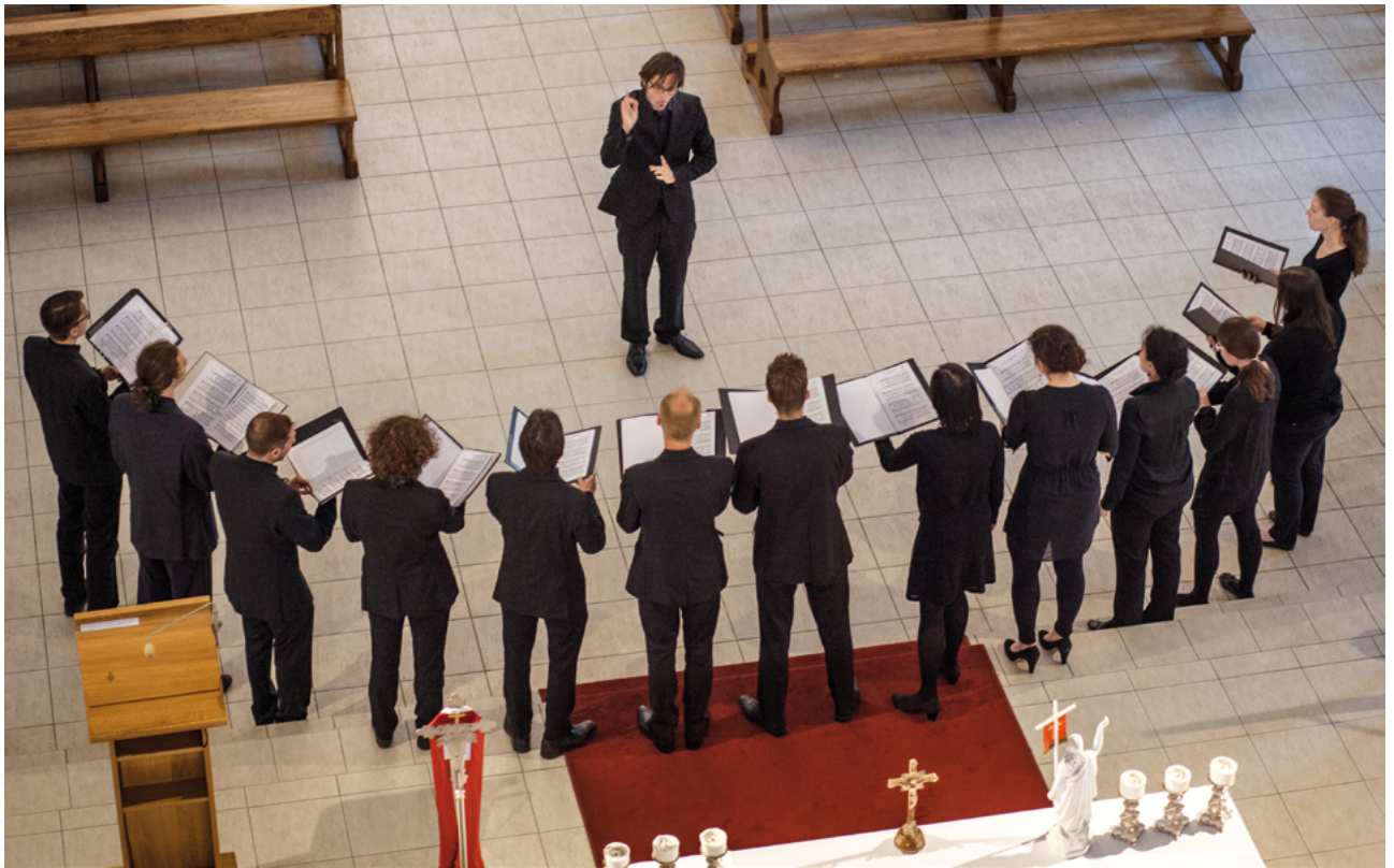
Vocalino Wettingen (Suisse)