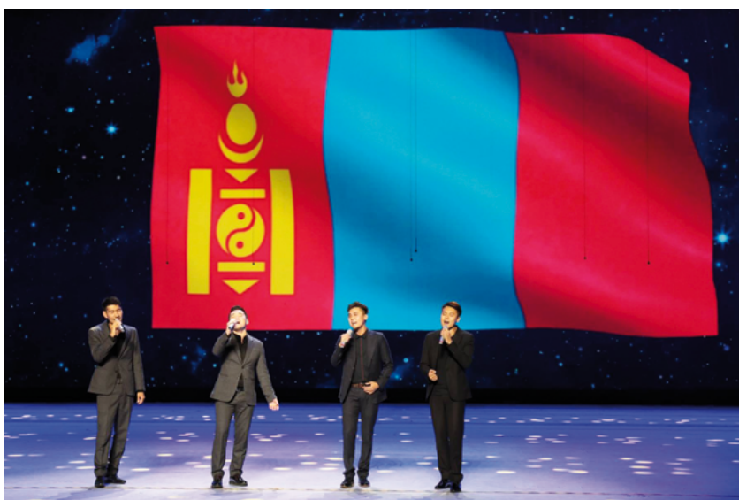
Bid4Band de la République de Mongolie

Après le festival de Kaili a eu lieu le 14 ème Festival Culturel des Steppes de Mongolie Intérieure et Festival Choral "Sound From the Silk Road" de la Fédération Internationale pour la Musique Chorale , accueilli avec le Bureau de Mongolie Intérieure des Groupements Artistiques