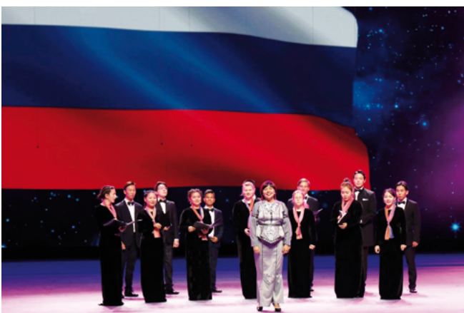
Tchaikovsky Art Academy Choir (Russie)