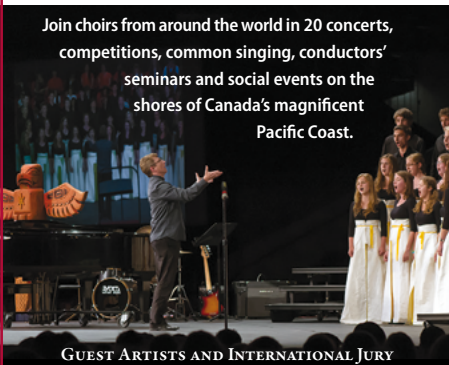
GUEST ARTISTS AND INTERNATIONAL JURY

Join choirs from around the world in 20 concerts, competitions, common singing, conductors' seminars and social events on the shores of Canada's magnificent Pacific Coast.