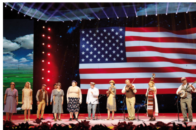
Le Chuck National Band et l'Harmonie du Kentucky (USA)