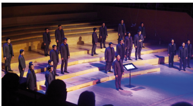
Le Choeur A/eron , Philippines (dir. Christopher Ong Arceo)