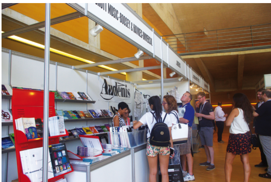
Exposition chorale mondiale à l'Auditori