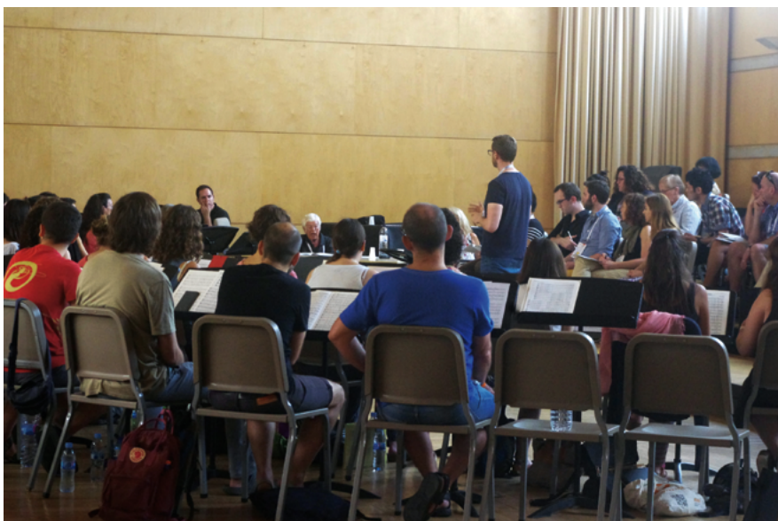
Master class avec Prof. Helmuth Rilling

qui dispose non seulement de salles de concerts, mais qui est également le siège de l'Académie de Musique de Catalogne ( ESMUC ) et du Musée de la Musique. Des activités ont également eu lieu sur le Campus de la Ciutadella de l'Université de Pompeu Fabra ( Ciutadella Campus of Pompeu Fabra University, UPF ).