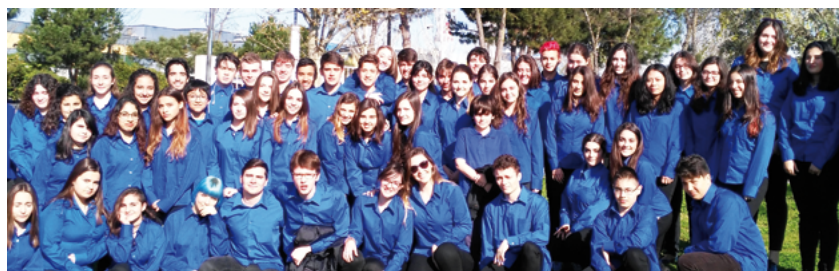
Fig. 6: Le chœur de jeunes: tous les garçons du projet choral "Voces para la convivencia" ont chanté au cours de leur puberté, et continuent de chanter durant leur adolescence

Le répertoire choral contient les éléments du cursus vocal, mais il incombe à l'enseignant de présenter ces éléments de la manière appropriée et au bon moment pour ses propres étudiants. 10 Les étudiants devraient participer à des activités de chant qui incluent un large éventail de groupes différents, que ce soit en duo, en petits ou en grands ensembles. En outre, il est important que tous les étudiants ne chantent pas toujours en même temps, mais qu'ils aient différentes occasions d'écouter et d'évaluer leurs pairs. La plupart du temps, les élèves évaluent avec précision les réalisations spécifiques de leurs collègues. Cela conduit à une prise de conscience plus claire de l'objectif poursuivi.