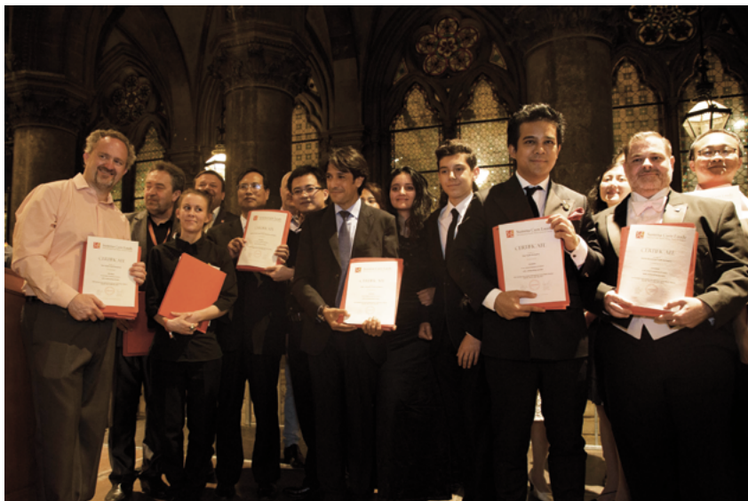
Les chefs de chœur recevant leur certificat à la mairie de Vienne