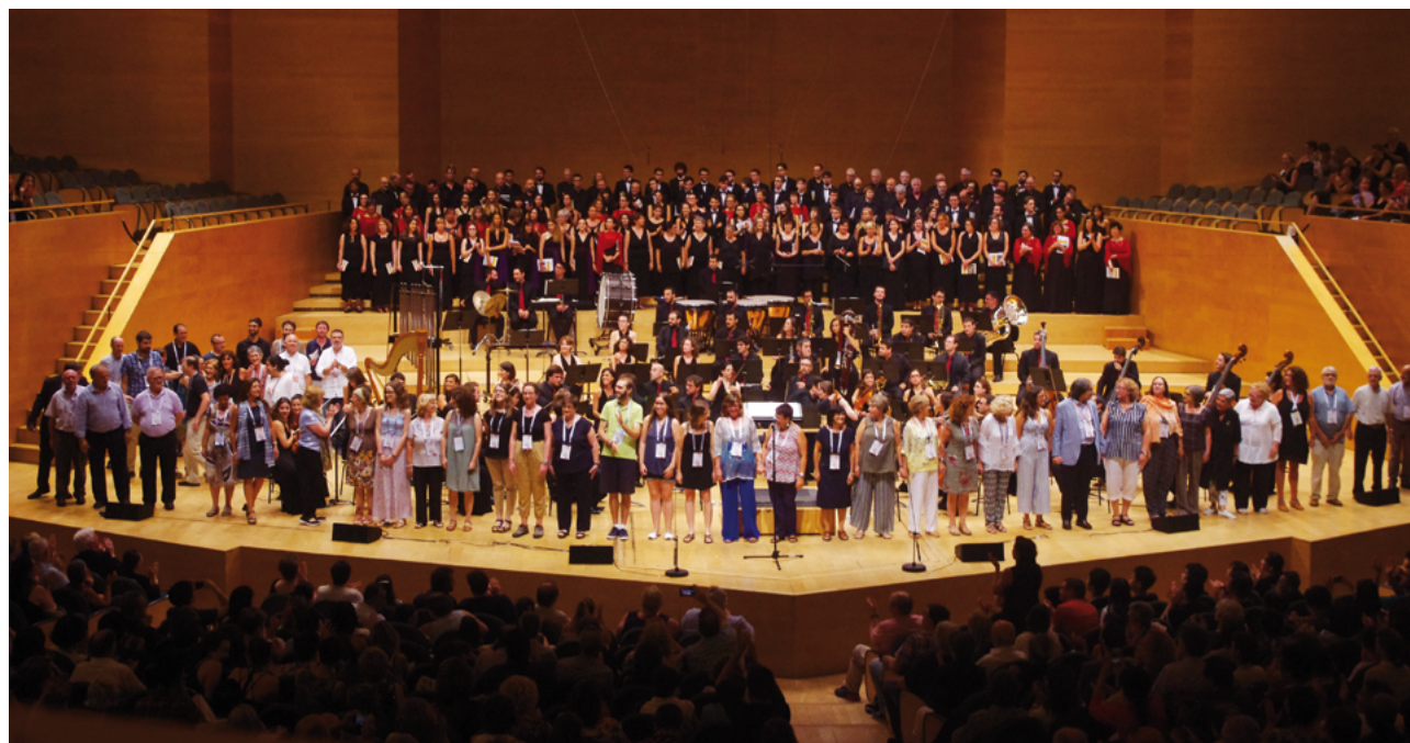
Hommage aux bénévoles du symposium lors du concert de clôture (l'Auditori de Barcelone, le 29 juillet 2017)