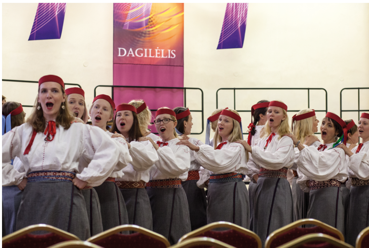
El coro femenino Emajõe Laulikud (Estonia)