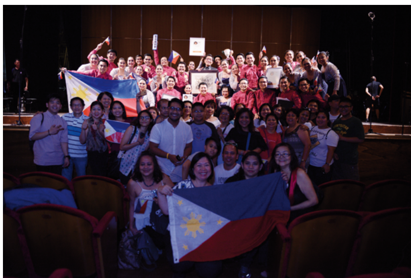
El Coro de Cámara de Manila celebrando la victoria