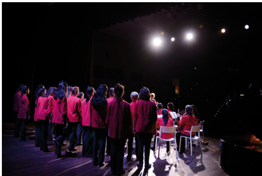
Pymble Chorale (Australia)