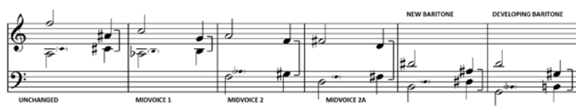
Fig.1 Estadios del desarrollo laringeo masculino en la adolescencia 2