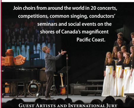
GUEST ARTISTS AND INTERNATIONAL JURY

Join choirs from around the world in 20 concerts, competitions, common singing, conductors' seminars and social events on the shores of Canada's magnificent Pacific Coast.