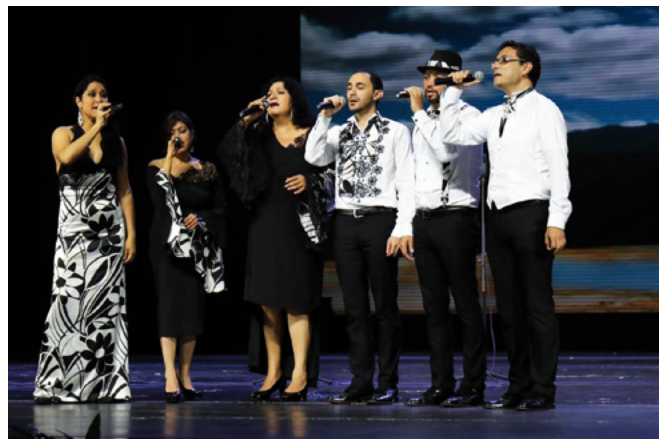
Voz en Punto from Mexico