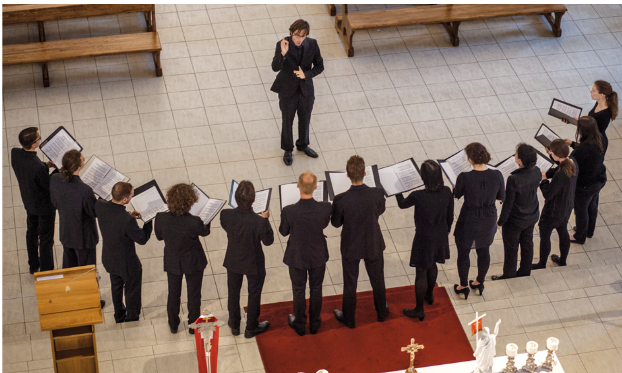
Vocalino Wettingen (Suiza)