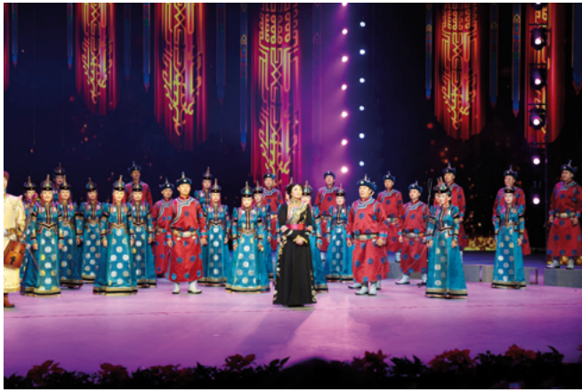
Inner Mongolia Youth Choir