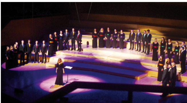
New Dublin Voices, Irlanda (dir. Bernie Sherlock)