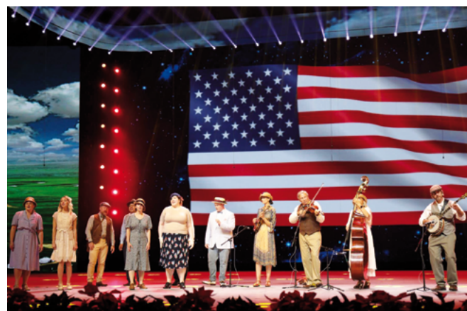
Chuck National Band y la armonía del Kentucky (Estados Unidos)

Traducido del inglés por María Ruiz Conejo, España Revisado por el equipo de español del BCI