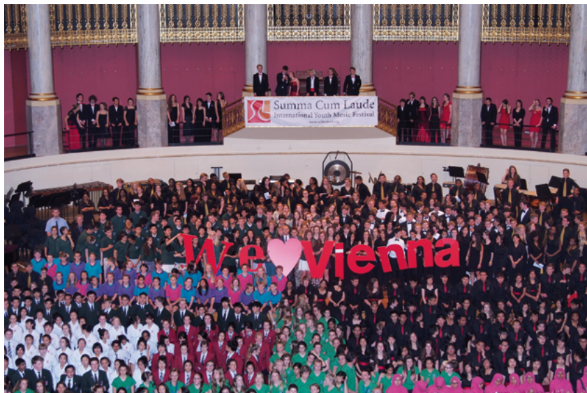
Los coros participantes en el Wiener Konzerthaus

combinen agrupaciones y se les da la oportunidad a los estudiantes a que asistan a un evento inolvidable. Mientras parece que Viena aun duerme, el Musikverein está rebotante de vida. Los buses llegan y descargan multitudes de jóvenes, que se dirigen a las salas de concierto de uno de los escenarios de música clásica más famosos del mundo. El coro canadiense también arriba y se prepara para la presentación decisiva. Se ve claramente la tensión entre los participantes. Con gran concentración, se desempacan los violonchelos, se afinan los violines y las arpas, se comprueba que la vara principal del trombón se desliza correctamente y, por supuesto, se realizan las vocalizaciones. Los directores de los coros aspirantes andan de un lado a otro mientras leen las partituras.