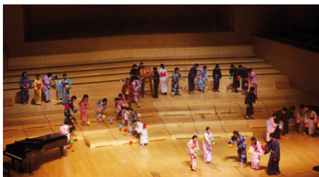
Tajimi Choir, Japón (dir. Yoko Tsuge)