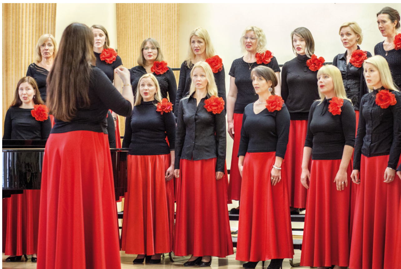
El coro femenino Emajõe Laulikud (Estonia)