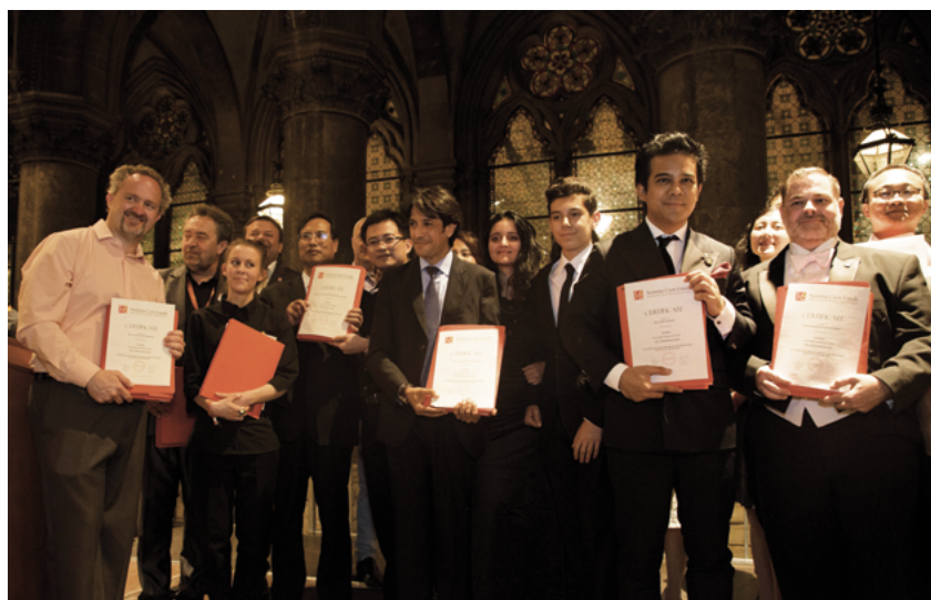
Directores recibiendo su certificado en el ayuntamiento de Viena

Revisado por Juan Casasbellas, Argentina