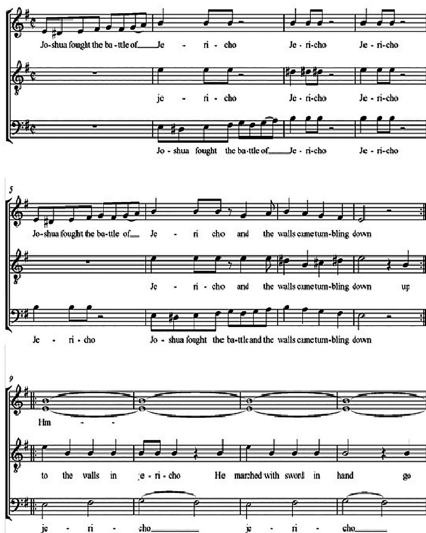
Un fragmento de una pieza coral "flexible" sobre la melodía de Joshua fit the battle: arreglado por Alfonso Elorriaga.