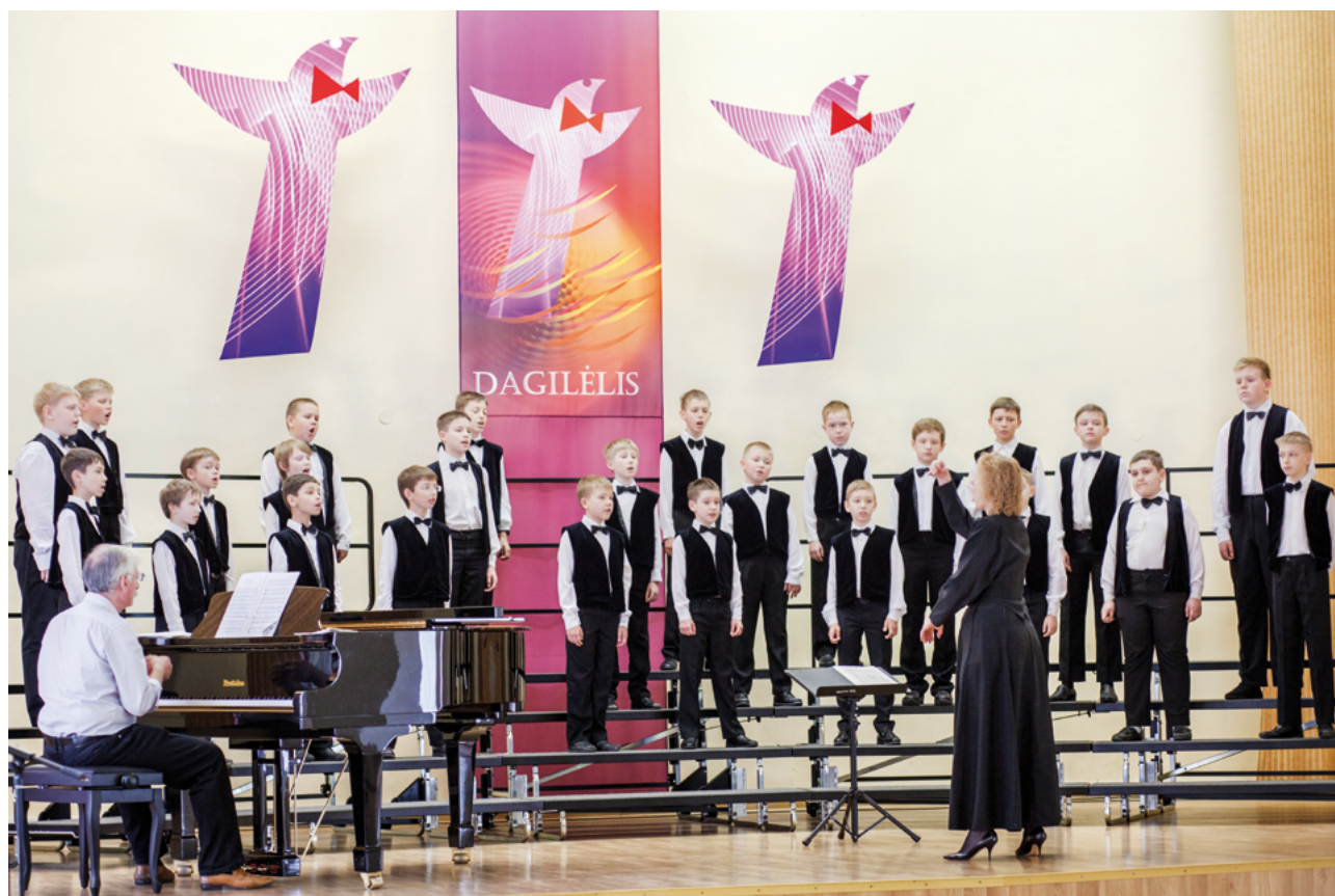
Coro de niños Iskra (Rusia)