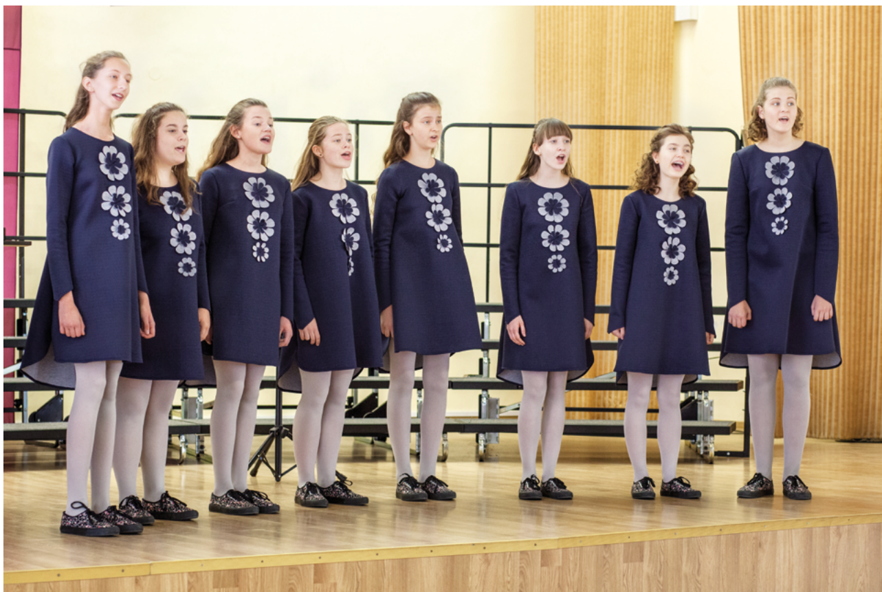
El conjunto vocal Sinkopės (Lituania)