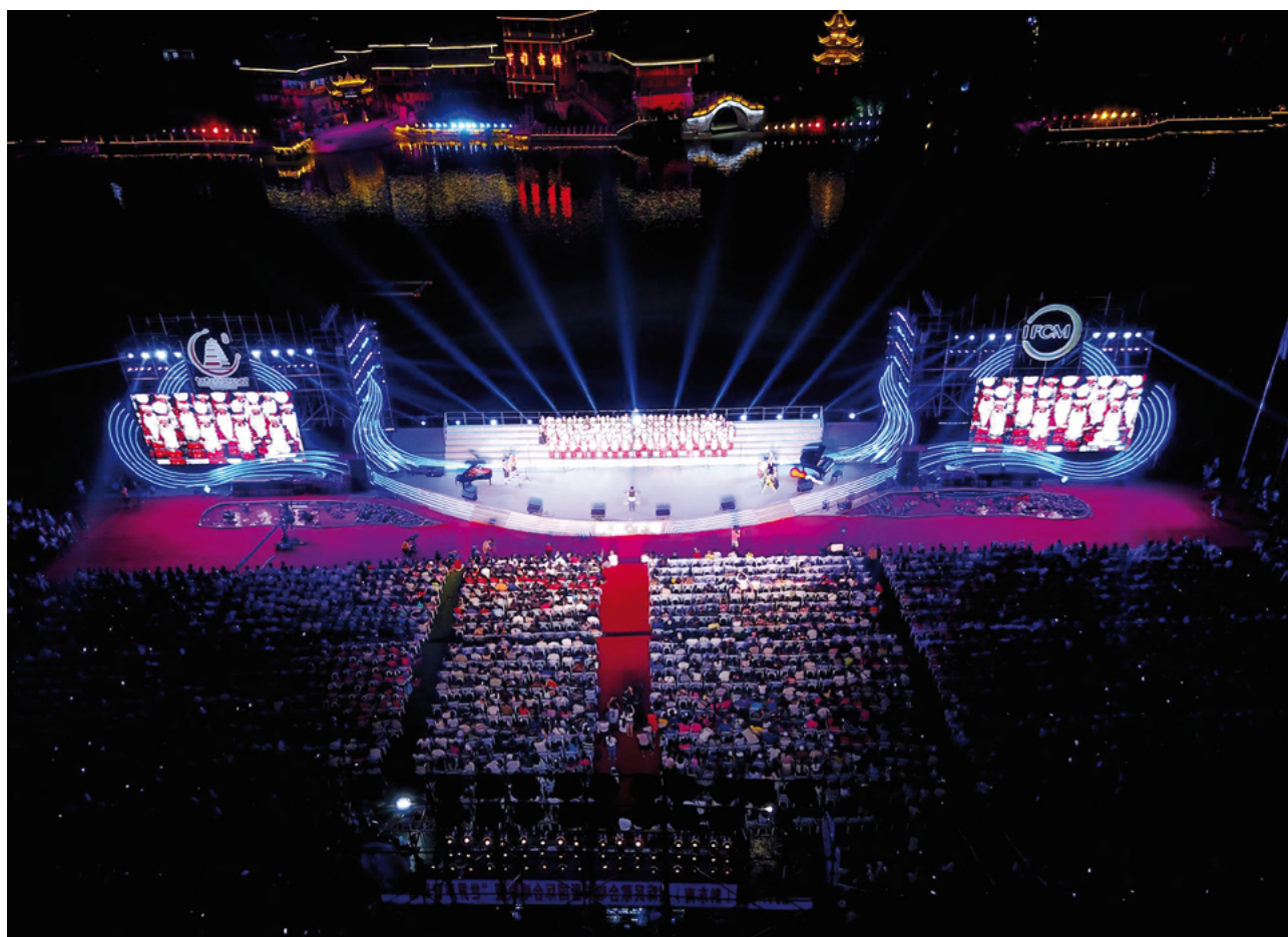
Ceremonia de apertura del Kaili International Folk Song Choral Festival

La grandiosa ceremonia de apertura del festival se celebró en la ciudad antigua de Xiasi, con las luces de la moderna ciudad reflejándose de fondo en las claras