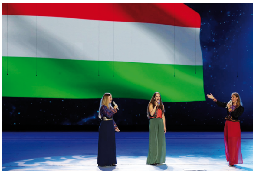
Ensemble Dalinda (Hungría)