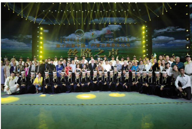
Ceremonia de clausura del 14th China Inner Mongolia Grassland Culture Festival y el festival coral "Sound From the Silk Road" de la FIMC

el 14th China Inner Mongolia Grassland Culture Festival and International Federation for Choral Music "Sound From the Silk Road" Choral Festival , organizado por el National Art Troupes de Mongolia Interior y la FIMC.