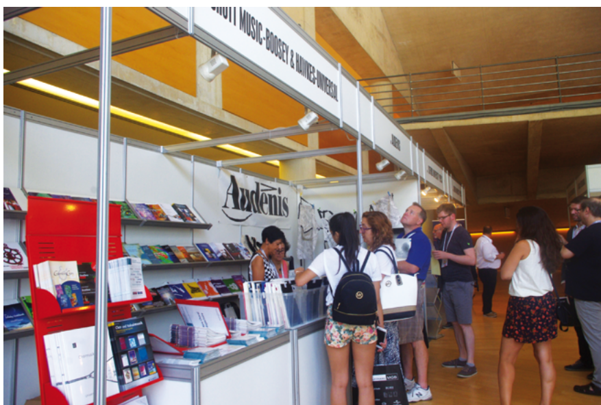
World Choral Expo en el Auditorio de Barcelona