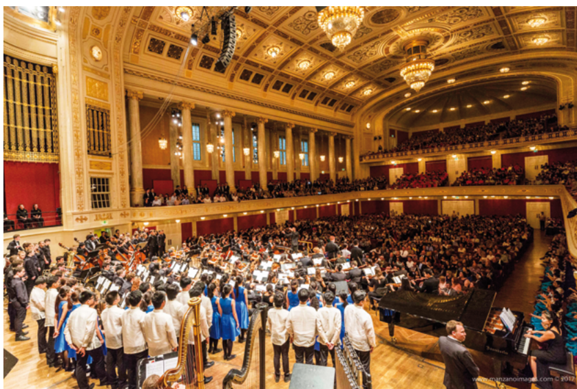
Concierto de gala de los ganadores en el 'Wiener Konzerthaus'