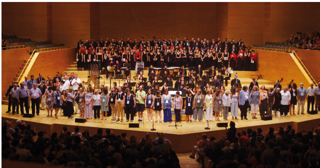
Ceremonia de reconocimiento a los voluntarios del Simposio durante el concierto de clausura (Auditorio de Barcelona, 29 de julio)