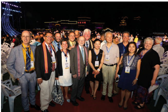
Los invitados del festival