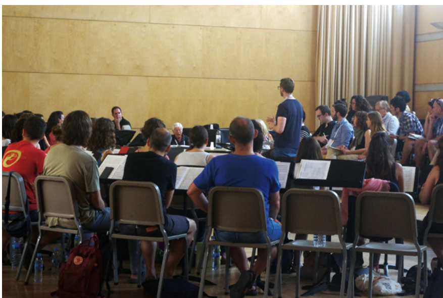
Clase magistral con el Prof. Helmuth Rilling

en el Campus Ciutadella de la Universidad Pompeu Fabra (UPF). El programa se estructuraba en tres grandes áreas: