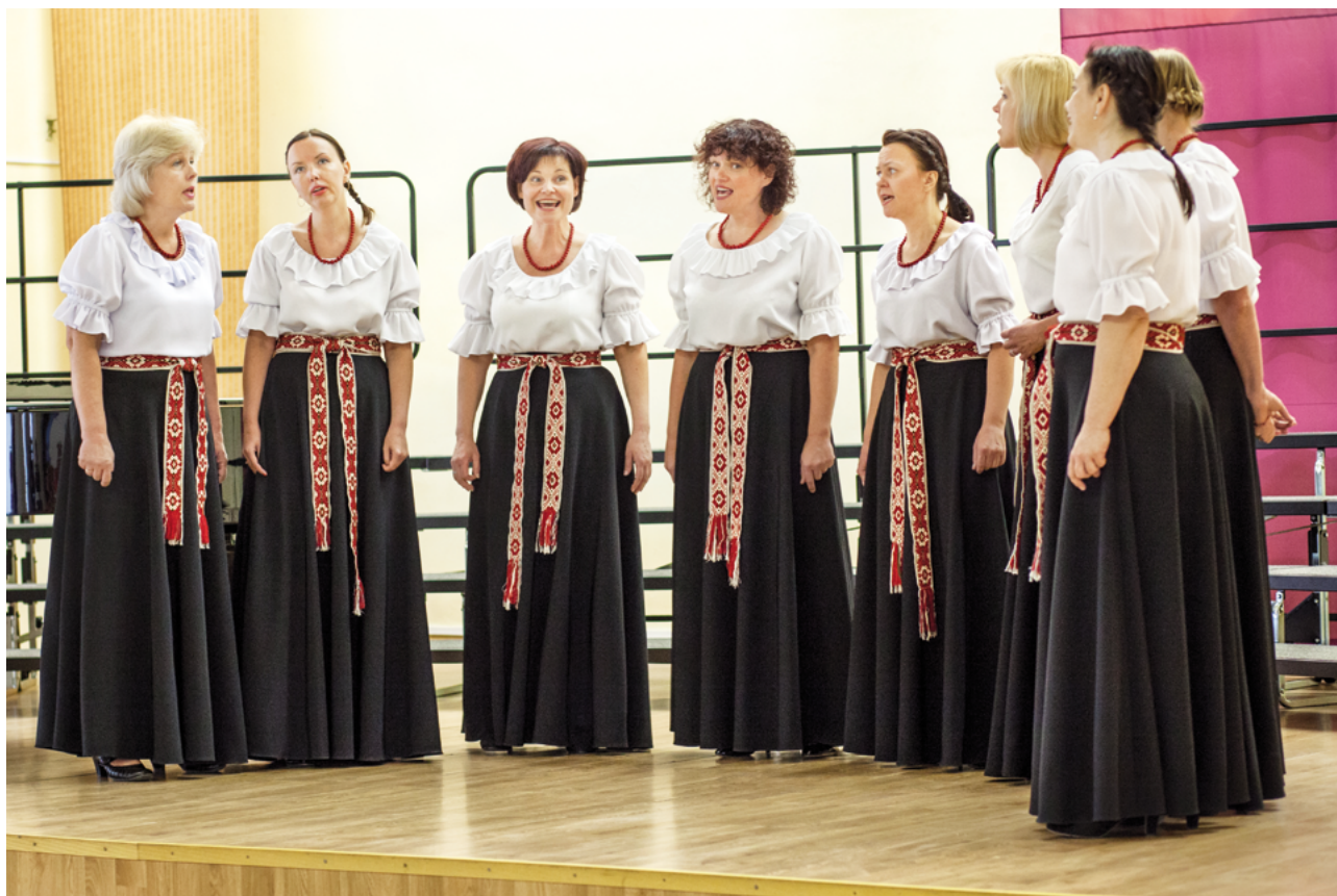
El conjunto vocal femenino Guns (Letonia)