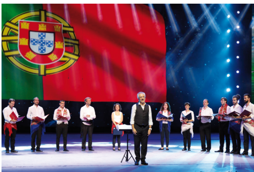
ECCE Ensemble (Portugal)