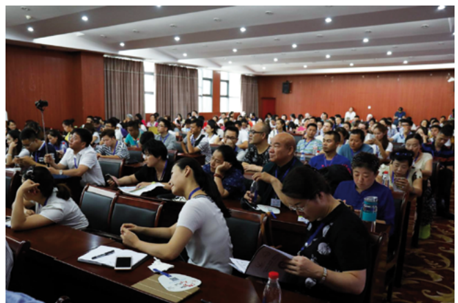
One lecture during the Kaili Festival