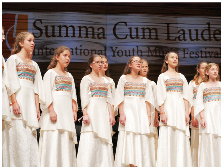
Coro Efroni de Israel en el MuTh, la sala de concierto del Vienna Boys Choir

Este anhelo por la diversidad musical e intercambio intercultural también moldea los demás elementos del festival. “Desde el principio, enfatizamos el intercambio cultural dentro del concepto de los talleres,