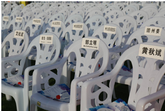
Expecting some celebrities