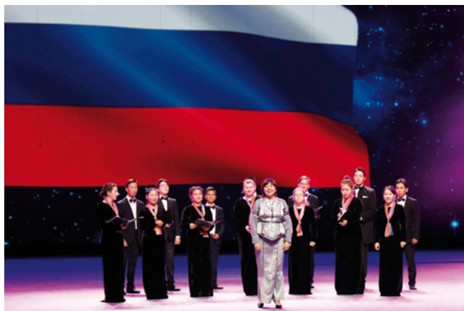
Tchaikovsky Art Academy Choir (Federación de Rusia)