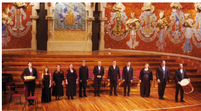
The Rose Ensemble (Estados Unidos) en el Palau de la Música Catalana (dir. Jordan Sramek)