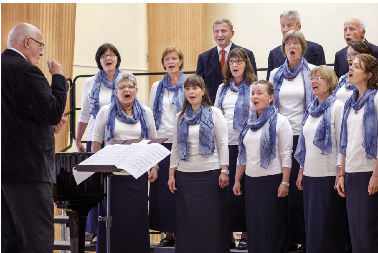
Neuruppiner A-cappella-Chor (Alemania)