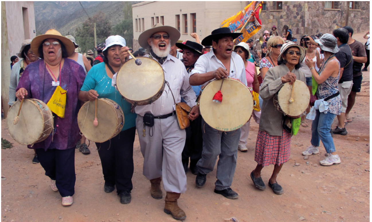
'Baguala' cantando en los Andes Argentinas

mayor, pero no es esa la razón del canto armónico en Africa, como tampoco lo es del canto tritónico, basado también en las notas constitutivas del acorde mayor utilizado en la tradicional baguala cantada por los naturales de la Sudamérica andina. Desde luego que la existencia de los sonidos armónicos ha ayudado a que este tipo de canto se haya desarrollado en sus orígenes ancestrales, pero en este caso esa habilidad se aprende haciéndola. Y en el caso africano tomó características especiales que lo transformaron en folclórico y popular, a través de clichés armónicos o melódicos o fórmulas que todos conocen y de esa manera permiten el canto comunitario.