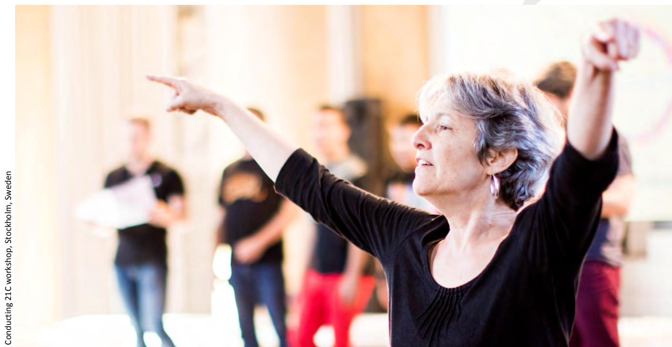
Conducting 21C workshop, Stockholm, Sweden