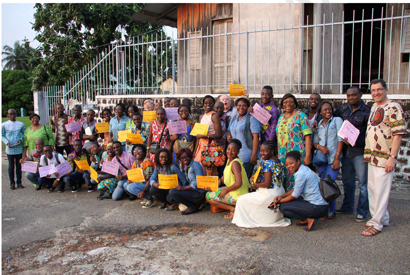
CWB Session in Libreville, Gabon (9-14 January 2017)

Lesen Sie mehr über die Missionen von CWB auf http://ifcm.net/cwb-2/