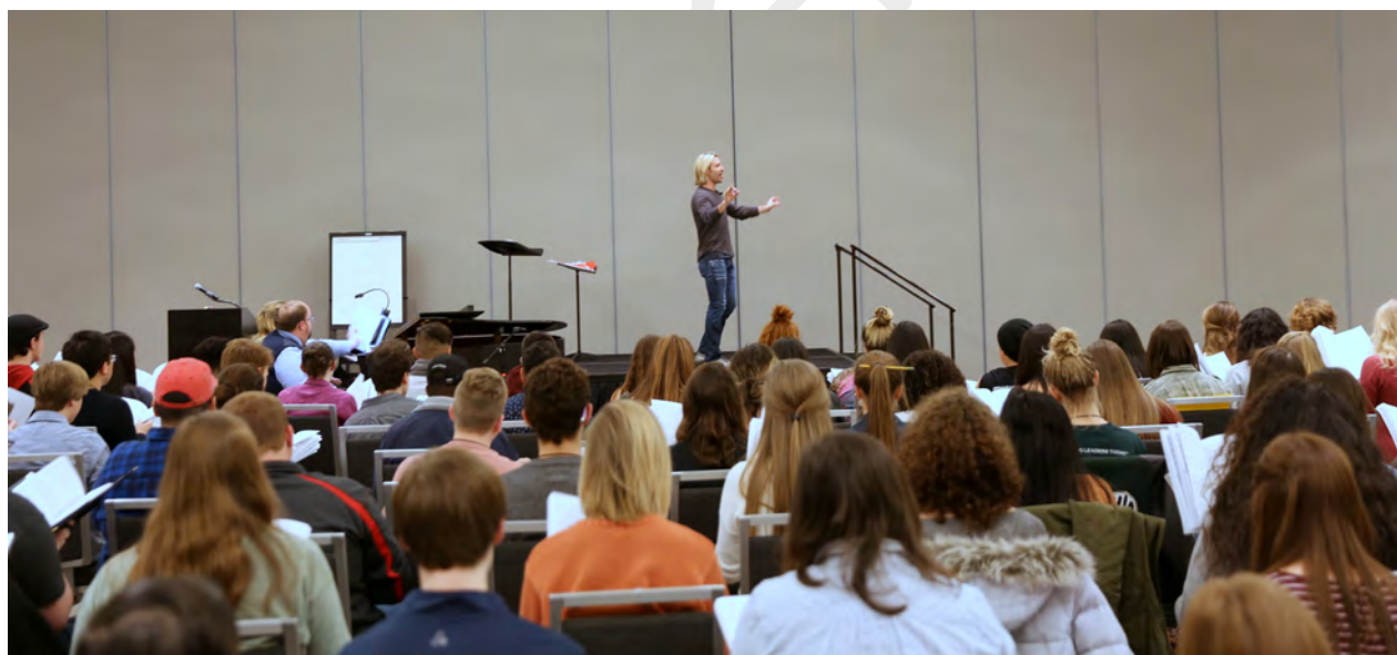
Ensayo del Coro Nacional de Honor de Escuelas Secundarias dirigido por Eric Whitacre

Una semana maravillosa con hermosa música para aquietar las almas atribuladas. La próxima Conferencia Nacional de ACDA será en Kansas City, Missouri, febrero / marzo, 2019, y serán las Bodas de Diamante de la Asociación Americana de Directores Corales.