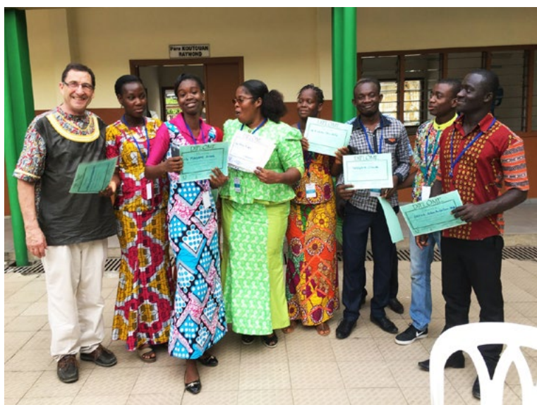
Abidjan, Côte d'Ivoire