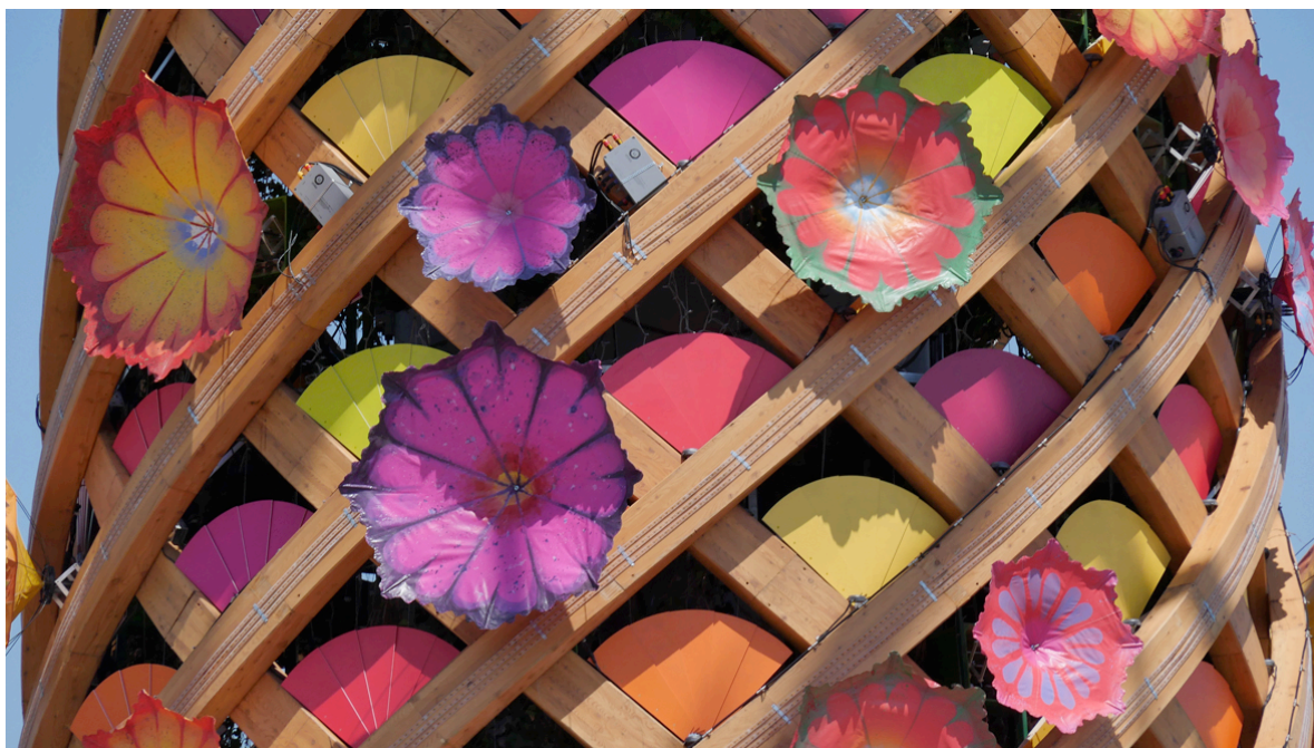
Expo Milano, the Tree of Life