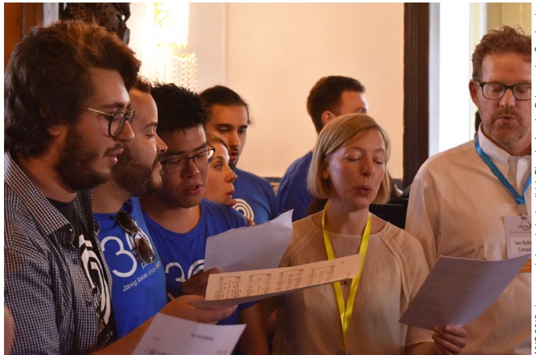
WYC 2019 singers and alumni singing 'Irish Blessing' at the Palacete dos Condes de Monte Real. IFCM new home