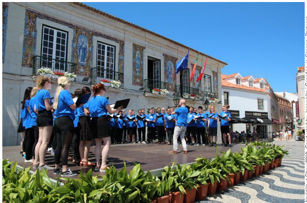
World Youth Choir 2019, Conducted by Josep Vila i Casañas, in Cascais, Portugal