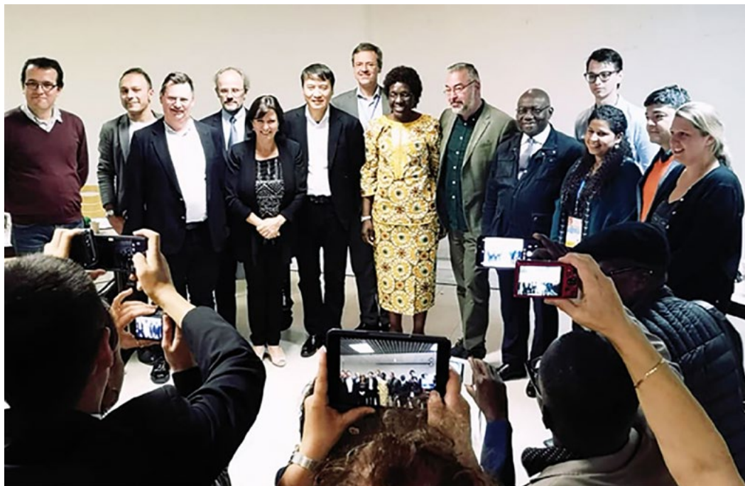
The new leadership team of the International Music Council