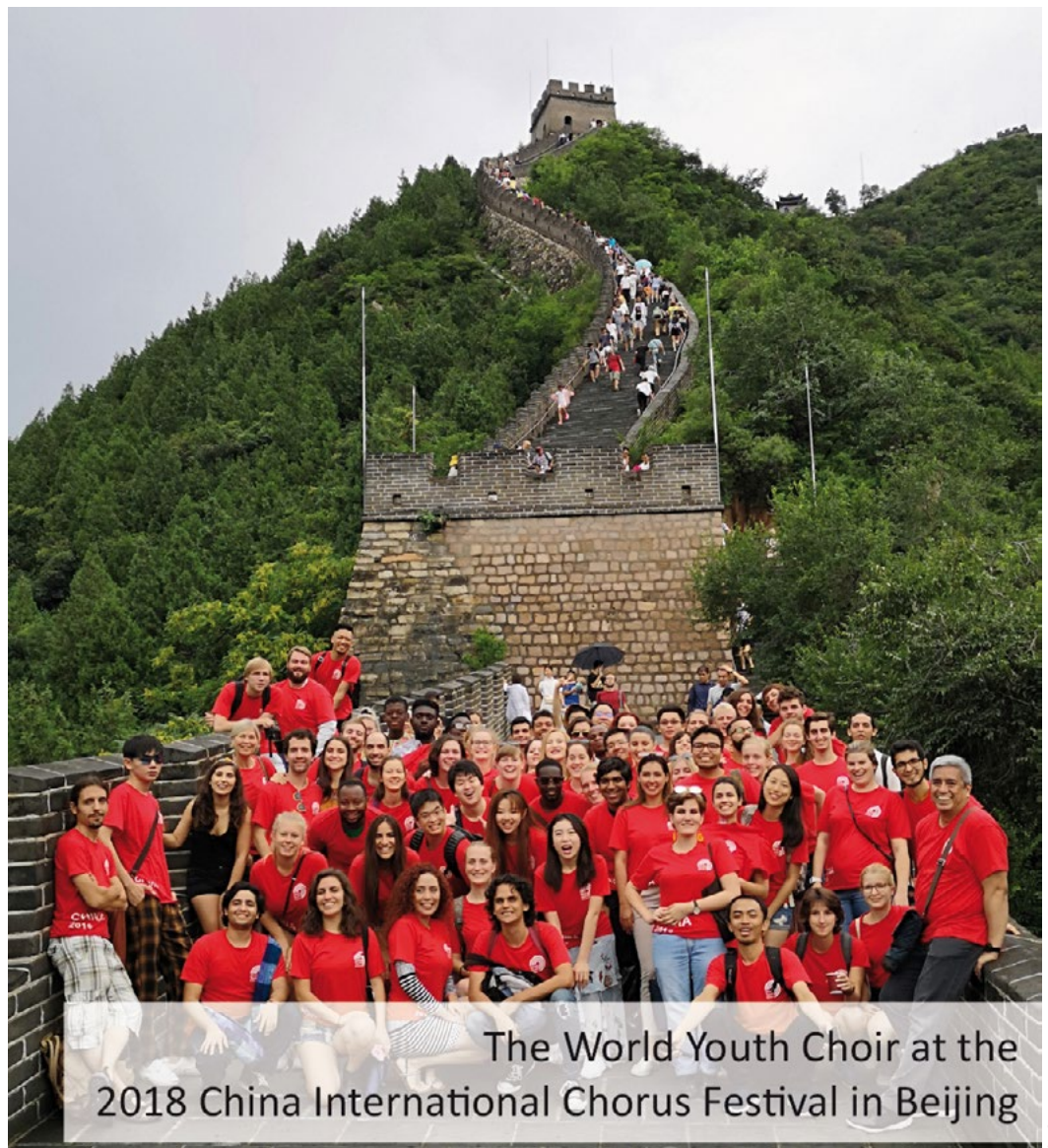
The World Youth Choir at the 2018 China International Chorus Festival in Beijing