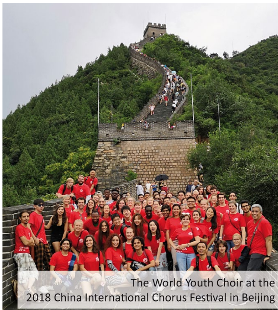
The World Youth Choir at the 2018 China International Chorus Festival in Beijing