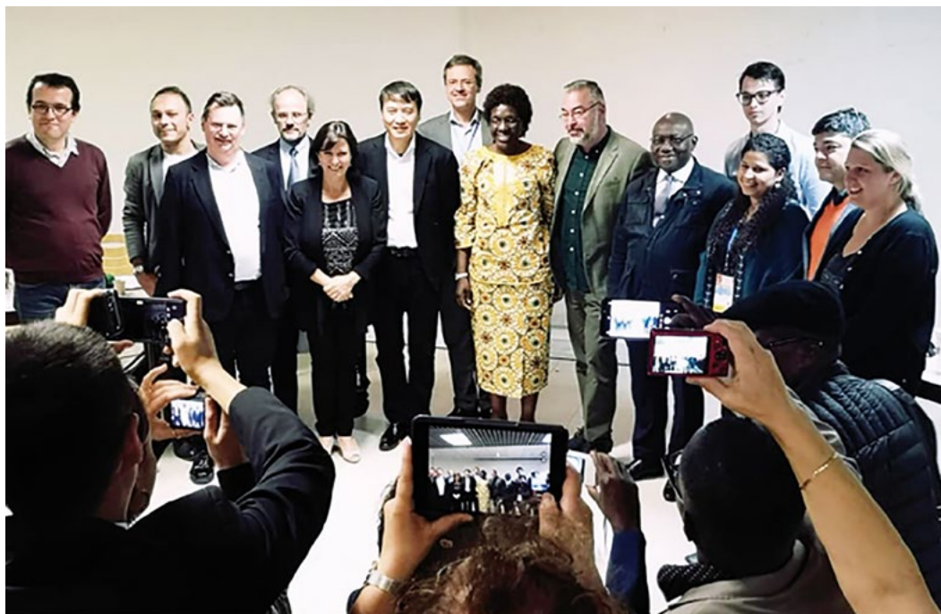
The new leadership team of the International Music Council