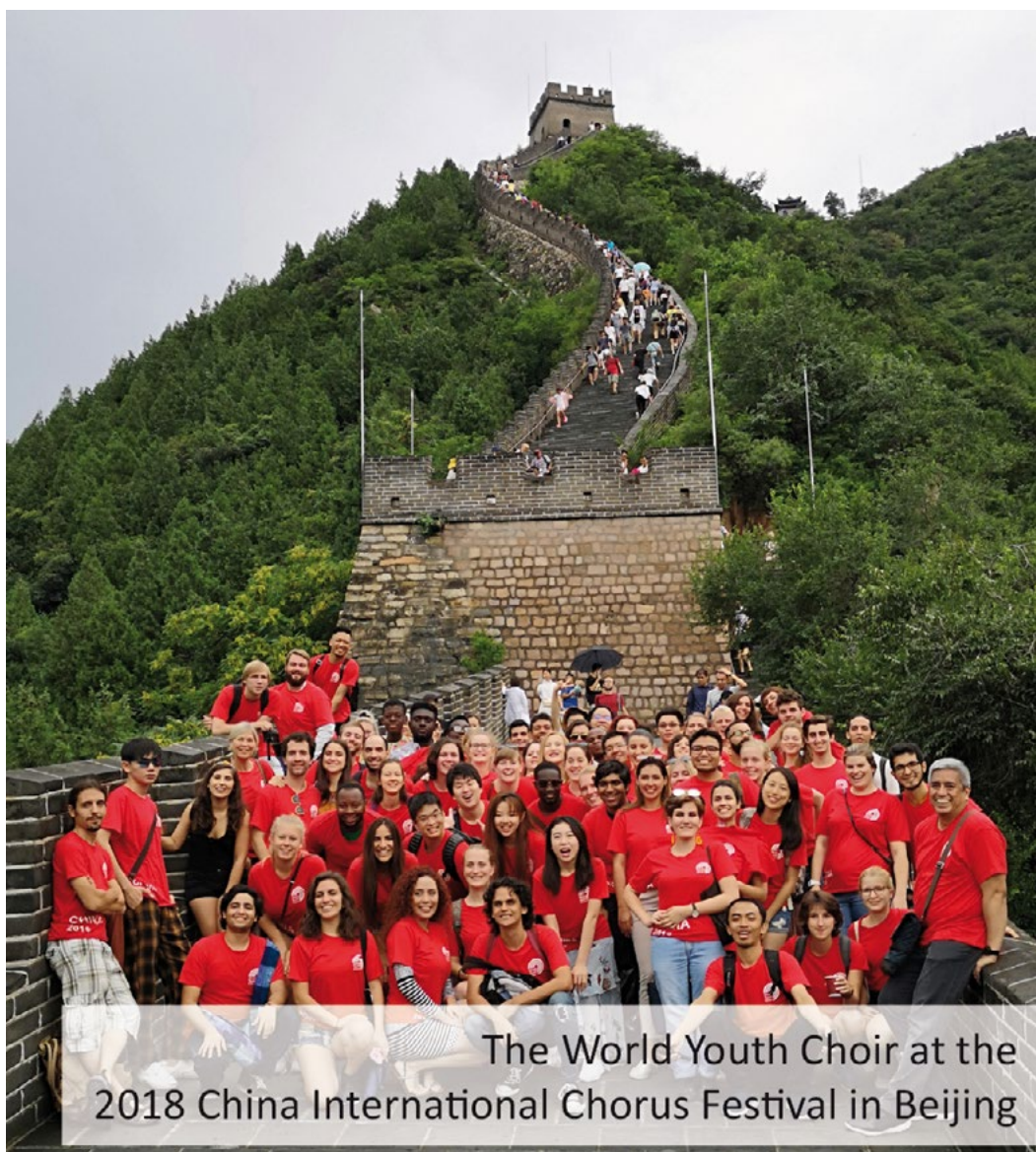
The World Youth Choir at the 2018 China International Chorus Festival in Beijing