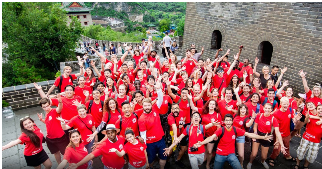
WYC 2018 on the Great Wall of China