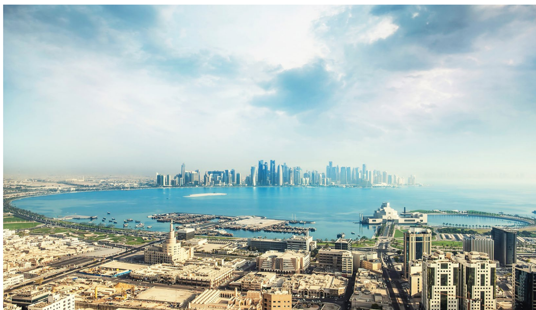
West Bay skyline, Doha, Qatar