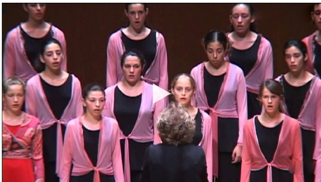
The Efroni Choir, two Songs from the Yemenite tradition

2005年–2011年，Maya成为国际合唱联盟 (IFCM) 董事会成员之一，并为我们的合唱世界带来了巨大、积极的改变与贡献。2005年，世界青年合唱团在Zimriya、以色列世界合唱团大会、以色列合唱协会、Jeunesses Musicales Israel. 的共同主办下成功举办。2006年，Maya协助国际合唱联盟 (IFCM) 在耶路撒冷举行首届多元文化和种族会议，在这个将耶路撒冷作为三大亚伯拉罕宗教、传统和文化的中心：基督教、伊斯兰教和犹太教。多年后，随着卡塔尔 WSCM 2023/24 的临近，IFCM 仍然重视这一愿景。不幸的是，活动最后由于当时的政治因素而被迫取消。Maya随后在她所写的报告中说道：“来自基督教、犹太教和