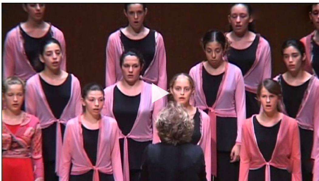
The Efroni Choir, two Songs from the Yemenite tradition