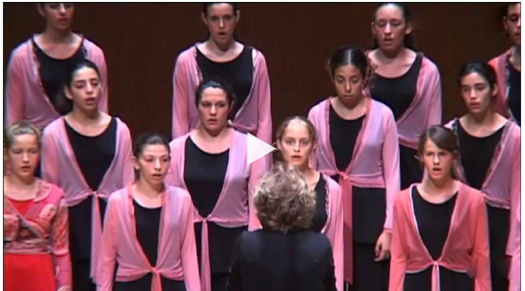
리온 에프론 합창단 - 2개의 예민 전통

2005년부터 2011년까지 Maya는 IFCM의 이사였으며 합창 커뮤니티에 막대한 긍정적 기여를 했습니다. 2005년에는 이스라엘의 세계 합창단 총회인 짐리야(Zimriya)와 이스라엘 합창 단체인 할렐(Hallel) 그리고 이스라엘 쥐네스 뮤지칼(Jeunesses Musicales Israel)이 세계 청소년 합창단(World Youth Choir) 세션을 구성했습니다. 2006년에 Maya는 예루살렘이 세 가지 위대한 아브라함계 종교이며 전통, 문화인 기독교, 이슬람교, 유대교의 중심지라는 점에 초점을 둔 최초의 다문화 및 민족 컨퍼런스(Multicultural and Ethnic Conference)를 개최하는데 도움을 주었습니다. 이 비전은 IFCM이 카타르 WSCM 2023/24에서 여전히 가치를 두고 있는 것입니다.