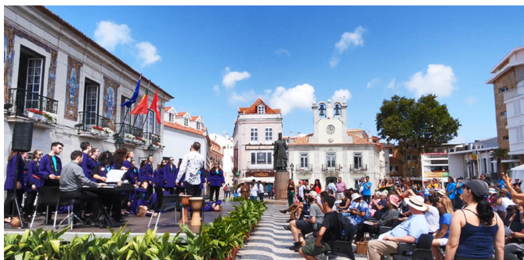
World Choral Expo 2019 in Cascais, Portugal

Die IFCMeNEWS werden jeden Monat einen oder zwei der zur WCE 2022 eingeladenen Chöre vorstellen. Hier lernen Sie die beiden professionellen Chöre kennen, die Sie hören und mit denen sie werden arbeiten können.