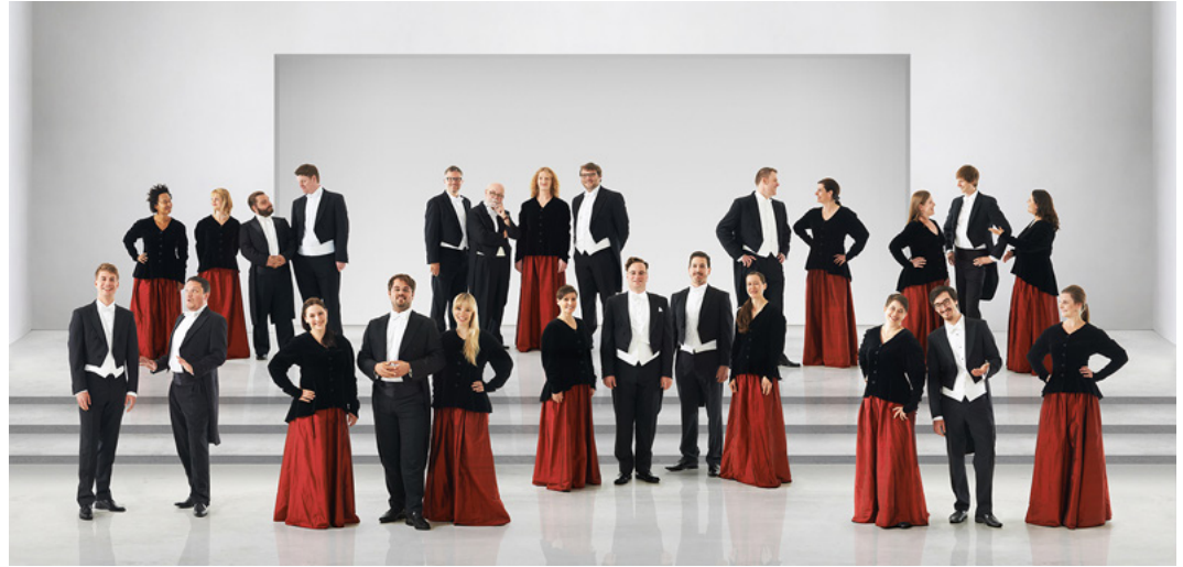
Kammerchor Stuttgart

합창단의 세계적인 명성을 반영합니다. 발매한 100개의 CD 중 45개는 에디슨(Edison), 디아파존(Diapason) 및 ICMA와 같은 국제상을 수상했습니다.