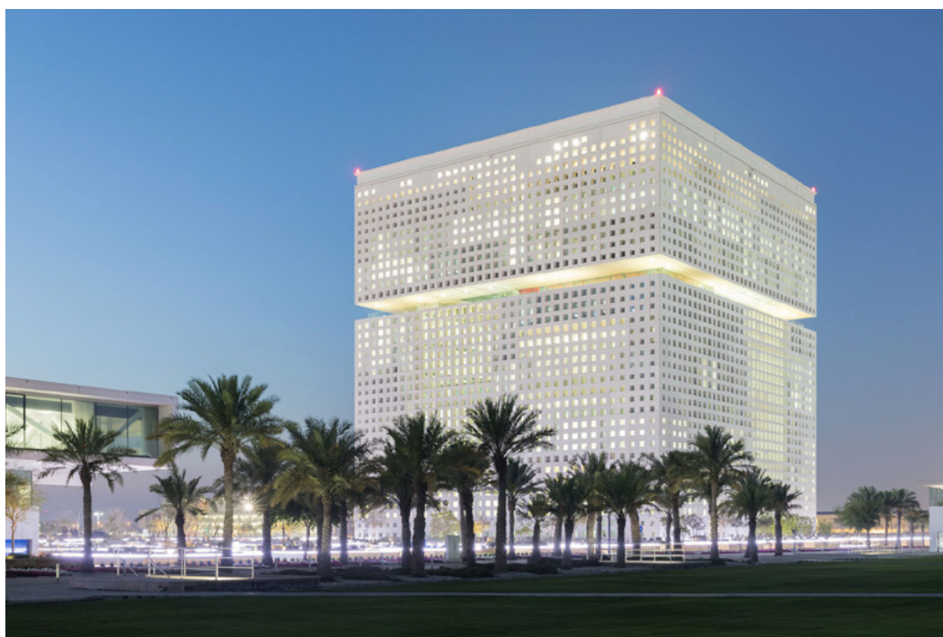
Qatar Foundation Headquarters in the evening