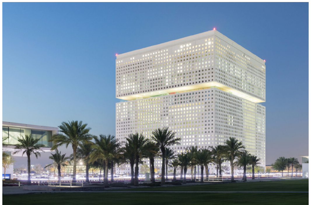
Qatar Foundation Headquarter in the evening

カタール財団は、保健、教育、芸術、地域社会の発展を支援することが使命であり、昔からカタール国内の文化機関や地域のイベントの多くの中心となっていました。カタール・フィルハーモニック管弦楽団、カタール音楽学校、国際教育改革サミット、数々のスポーツ・イベント、“教育都市”の国際的な大学8校のキャンパス、医学研究施設などがすべてカタール財団の傘下にあるのです。そして2021年、カタール財団はそのカレン