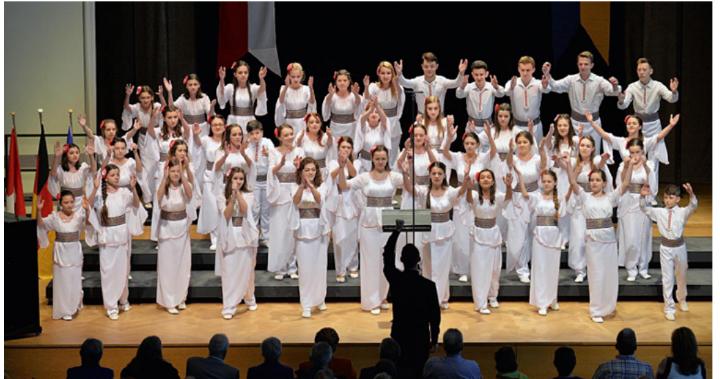
モーゼイカ・シンガーズ( Mosaica Singers ) (ヨルダン)