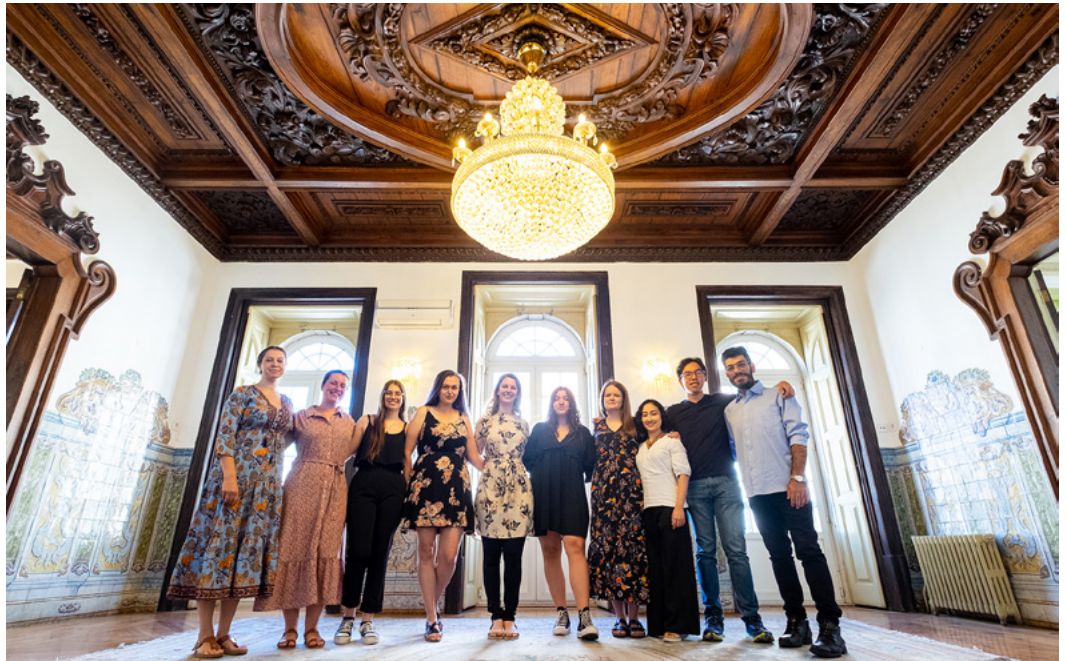
YOUNG participants at the Palacete dos Condes de Monte Real