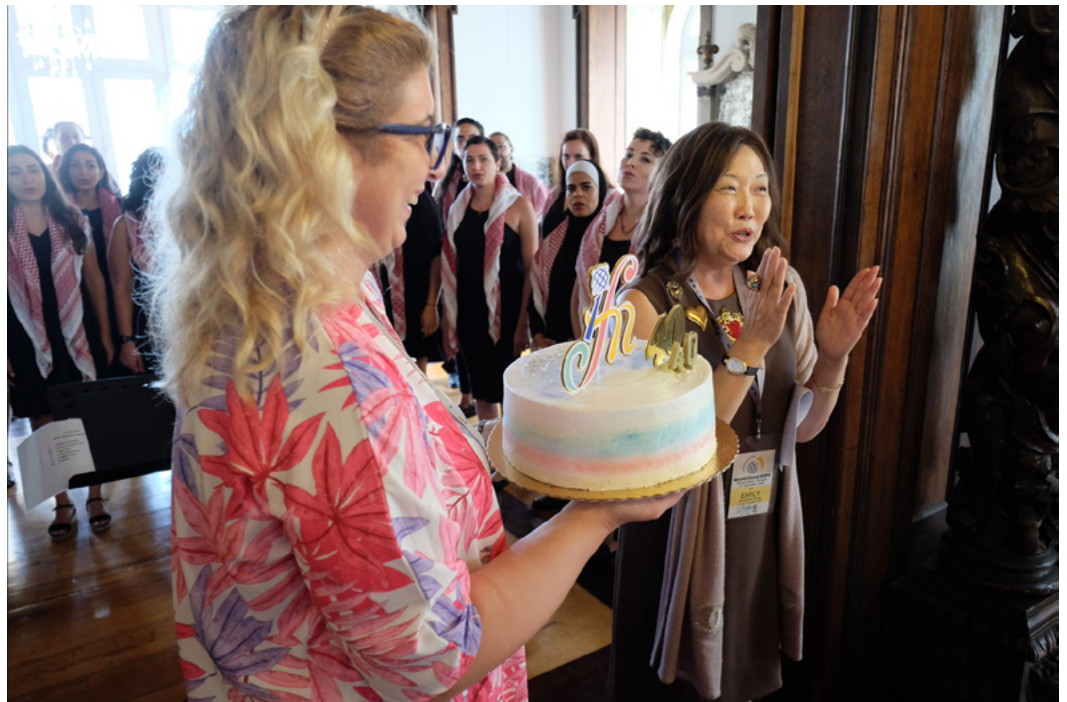
Happy Birthday IFCM!

2022년 총회 후 모자이크(Mosaïca, 요르단)의 카메오 콘서트로 시작하여 팔라세테(Palacete)의 아름다운 만찬회장에서의 점심으로 이어진 IFCM 40주년 공식 리셉션에 에밀리 쿠오 봉 회장이 회원들을 초대했습니다.