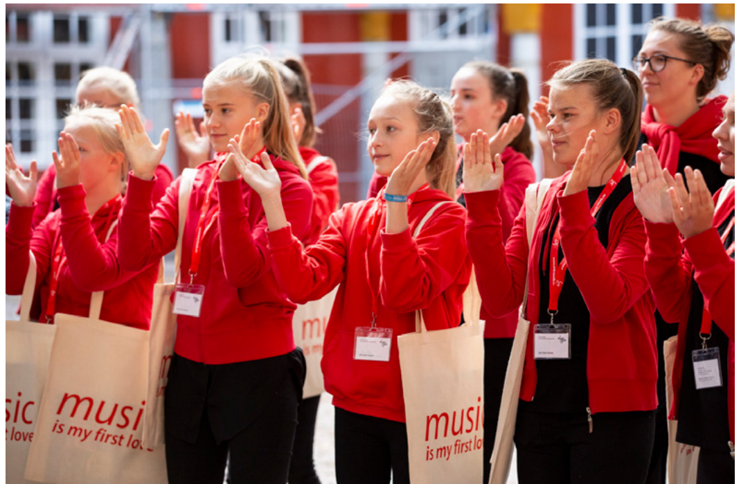
Eurotreff 2019

2021년 유로트레프 동영상 클립( EUROTREFF 2021 Trailer )을 보시고 분위기를 느껴보세요.