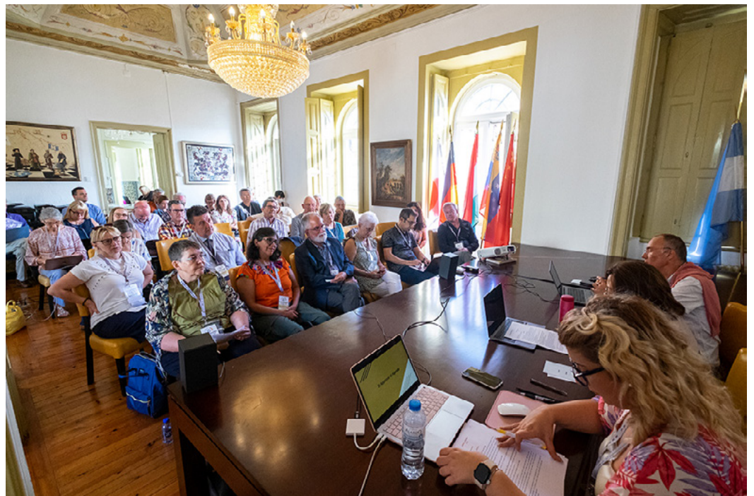
IFCM 2022 General Assembly at the Palacete dos Condes de Monte Real