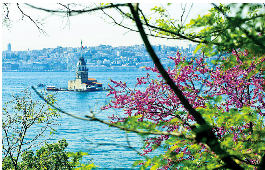
Judas trees blossoming before Maiden's Tower

Während wir das neue Jahr willkommen heißen, wächst die Spannung auf das WSCM 2023, nicht nur in Istanbul, sondern auf der ganzen Welt. Anmeldungen gehen weiter ein für das internationale Symposium, das in Beyoglu stattfindet, einem der touristischen Höhepunkte von Istanbul. Während des fünftägigen Symposiums werden 11 Chöre von 5 Kontinenten und 37 ReferentInnen aus 26 Ländern an 10 Veranstaltungsorten mitwirken. Insgesamt werden mehr als 16,000 ZuhörerInnen an den Symposiums-Veranstaltungen auf den 2,040 Plätzen im Opernhaus und an anderen Veranstaltungsorten teilnehmen. Wenn Sie an diesem Symposium teilnehmen wollen, das an den schönsten Orten Istanbuls stattfinden wird, müssen Sie Ihren Platz JETZT buchen. Für Einzelheiten zur Anmeldung und weiteren Informationen zum WSCM 2023 gehen Sie auf www.wscmistanbul2023.com . Anmeldeschluss für den Frühbucher-Rabatt ist der 15. Januar 2023.