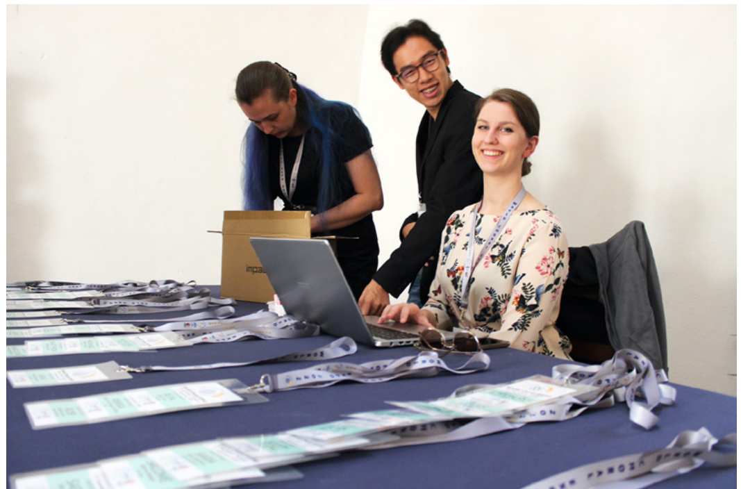
YOUNG 2022 - World Choral EXPO, Oeiras, Portugal

Nach dem großen Erfolg des YOUNG-Programms im Rahmen der World Choral EXPO 2022 freuen wir uns, das zweite YOUNG-Programm anzukündigen! Sind Sie zwischen 18 und 35 Jahre alt? Möchten Sie Teil des Organisationsteams des World Symposium on Choral Music 2023 sein? Die IFCM und die Choral Culture Association, Istanbul, Türkei, rufen junge internationale KulturmanagerInnen auf, Teil ihres Teams zu werden und ihre Erfahrungen und Kompetenzfelder in enger Zusammenarbeit mit dem Organisationsteam des WSCM 2023 zu erweitern.