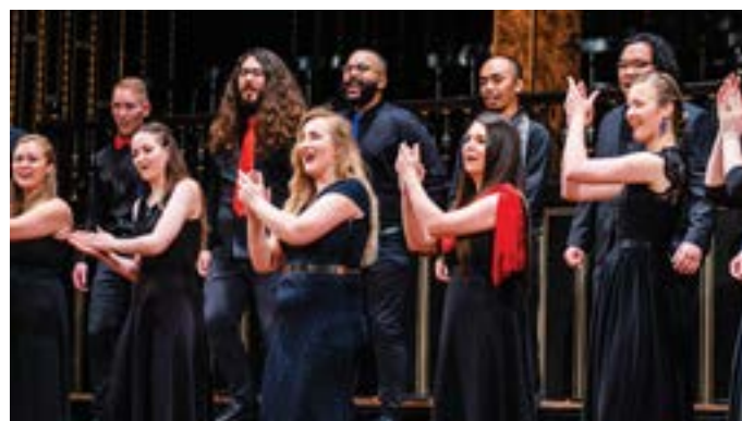
The World Youth Choir Alumni in Budapest in 2023

Daten und Konzertorte in Deutschland, den Niederlanden und Italien werden noch bekannt gegeben.