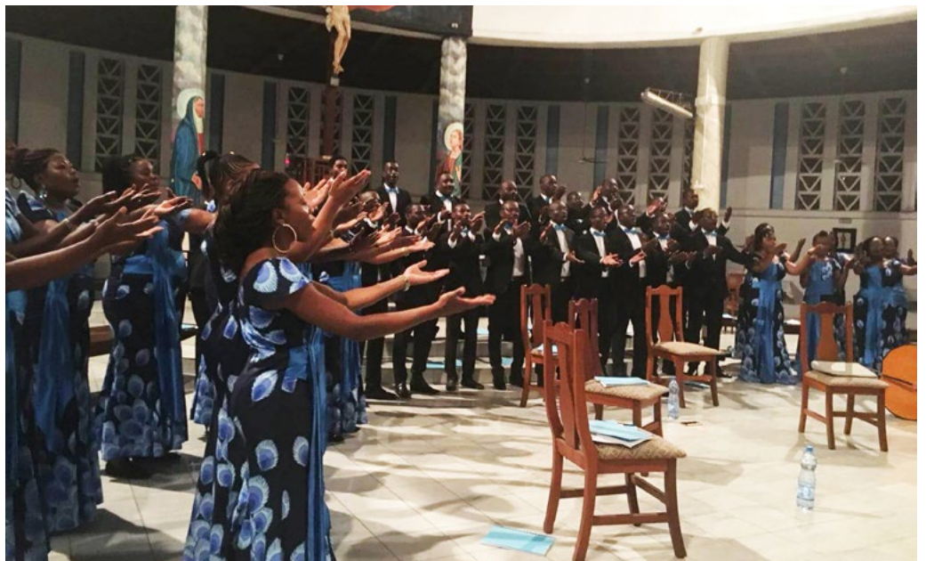
写真: ア・クール・ジョア・ガボン、合唱の日: Grand Choeur A Coeur Joie Gabon, Groupe Vocal Le Chant sur la Lowé, La Voix des Jeunes and Dominique Savio (ガボンのリーブルヴィルとポールジャンティにおける、ア・クール・ジョア合唱ウィークとトレーニング・セミナーの開幕演奏会)

さらに詳しい情報をお求めの方は、こちらをごらんください。 http://worldchoralday.org/