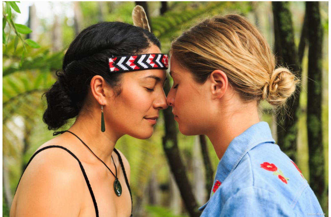
Hongi Rotorua

Las solicitudes se cerraron a fines de octubre para que los coros y presentadores formaran parte del programa oficial de WSCM2020, y el equipo organizador se complace en informar que al cierre de la fecha recibimos presentaciones de 177 coros y 181 presentadores, ¡más que en cualquier Simposio anterior! Nuestro panel internacional actualmente está reduciendo esta lista a aproximadamente 24 y 40, respectivamente, una tarea extremadamente difícil, pero que debería producir un importante avance en la conformación de Auckland 2020. Se notificará a los participantes seleccionados en diciembre y se lanzará oficialmente el programa a fines de febrero, cuando se abran las inscripciones. Regístrate ahora en https://www.wscm2020.com/ o síguenos en https://www.facebook.com/wscm2020 . ¡Esperamos darle la bienvenida en Auckland, Nueva Zelanda!