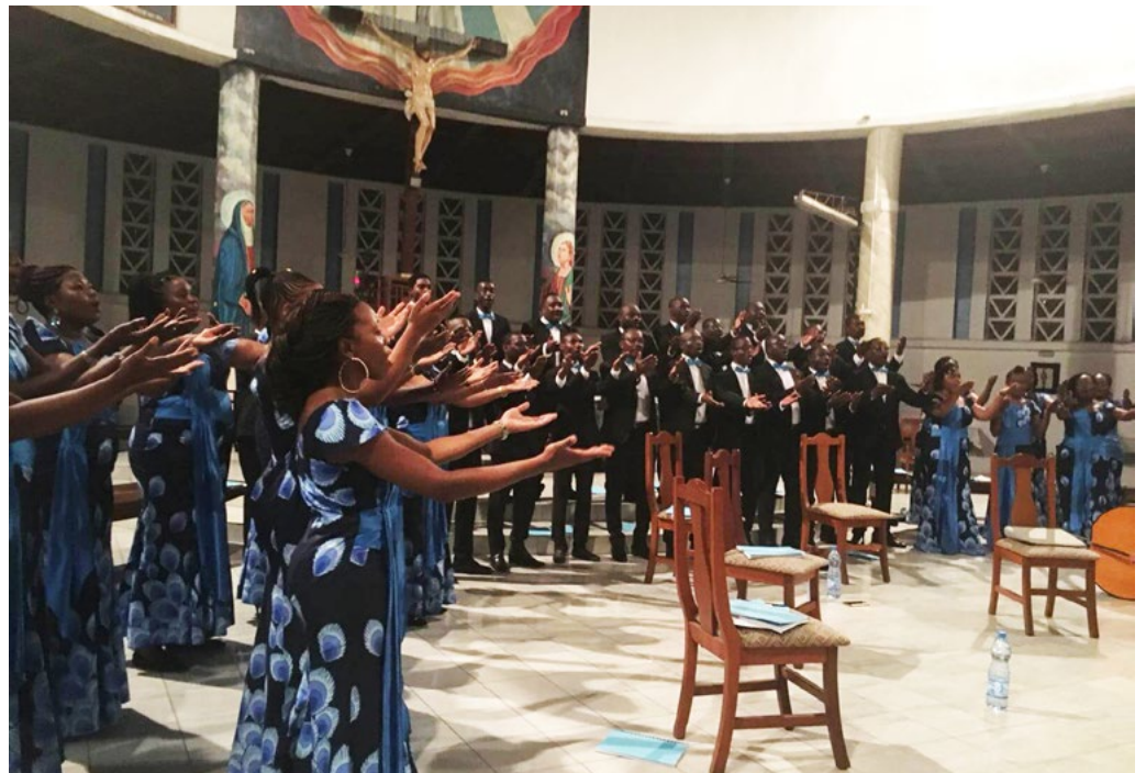
Días Corales A Coeur Joie Gabon: Gran Coro A Coeur Joie Gabón, Grupo Vocal Le Chant sur la Lowé, La Voix des Jeunes y Dominique Savio (Concierto de clausura de la semana coral A Coeur Joie y sesión de entrenamiento en Libreville y Port-Gentil, Gabón)

Gracias a la conmemoración especial de este año y a una intensa comunicación, nos complace anunciar que ya se han registrado eventos corales de más de 50 países, incluidos numerosos países (por ejemplo, Argelia, Bolivia, Ghana, Kenia, Macedonia, Wallis y Futuna, Zambia) donde nunca ha habido un evento del Día Mundial de la Coral antes. Haz clic aquí para ver todos los eventos del Día Mundial del Coral: http://worldchoralday.org/allevents/ y haga clic aquí para ver quién canta hoy: http://worldchoralday.org/calendar-view-2/ ¿Te gustaría saber cómo funciona? Mira este video corto aquí: VIDEO HERE