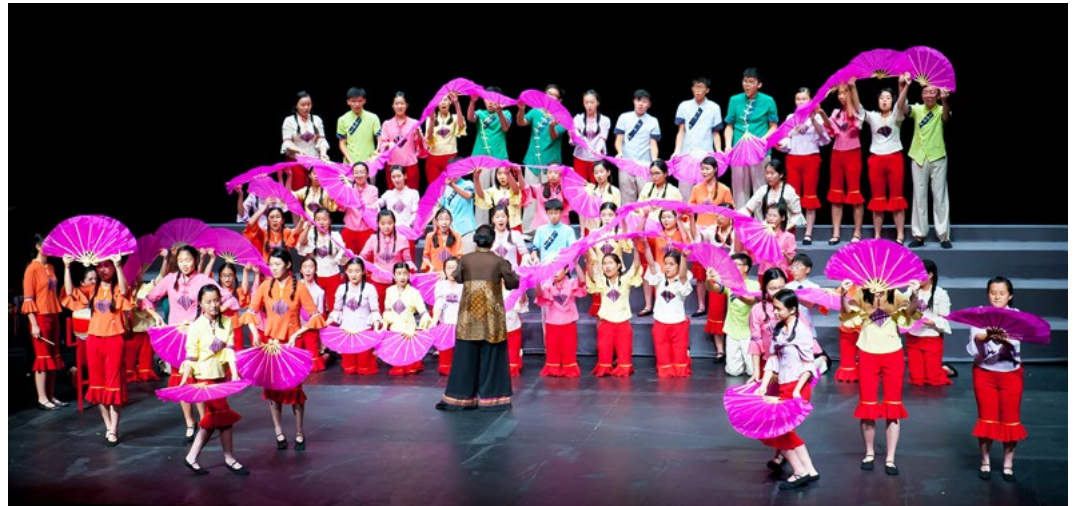
Hong Kong Children's Choir, cond. Kathy Fok

http://www.choralsummit2019.hk/ - Formulario de inscripción