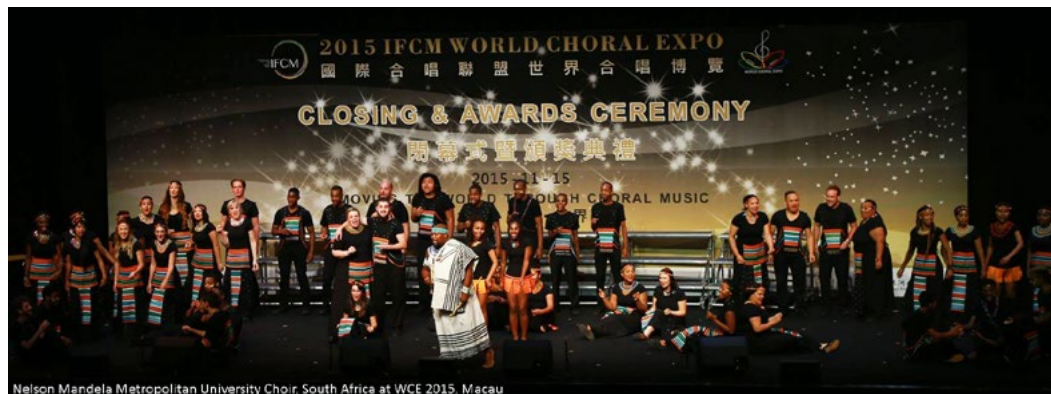
Nelson Mandela Metropolitan University Choir, South Africa at WCE 2015, Macau

World Choral EXPO 2015 | Highlights aus dem video der Abschlussveranstaltung