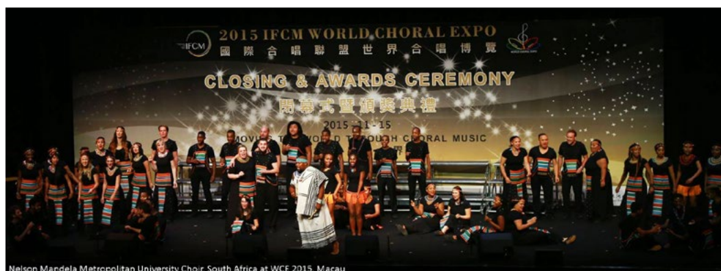
Nelson Mandela Metropolitan University Choir, South Africa at WCE 2015, Macau

Опыт хорового искусства во всей красе и завести новых поющих друзей в захватывающем Лиссабоне. См. World Choral EXPO 2019 для получения дополнительной информации об условиях участия и деталях регистрации. Следите за обновлениями на странице World Choral EXPO в Facebook. Всемирная хоровая выставка 2015 | Основные моменты из видео церемонии закрытия